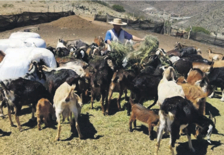
Crianceros advierten que la disparidad en las cifras se inició por la “recomendación” de funcionarios del SAG de reflejar menos ganado.

Ante la acusación formulada por un grupo de crianceros de la comuna de Ovalle, en la que se sostiene que funcionarios del SAG les habrían recomendado registrar en el Formulario de Movimiento Animal y los Certificados Zoosanitarios de Exportación un número de animales