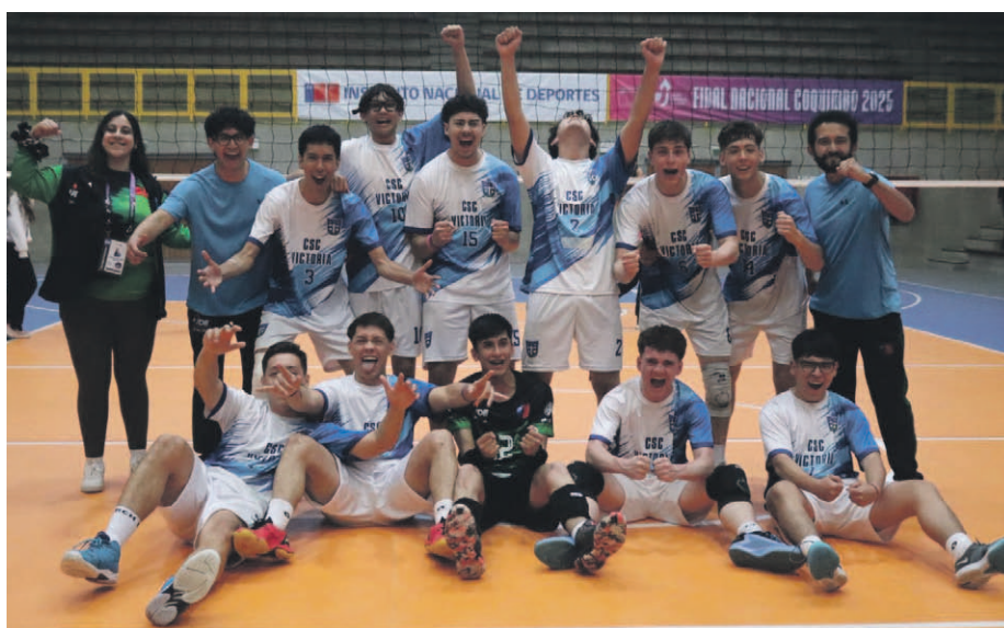
El representante de la Araucanía tendrá un duro encuentro ante la región de Valparaíso hoy en el gimnasio municipal de Tierras Blancas.

público han marcado una semana cargada de emoción, compañerismo y talento juvenil.