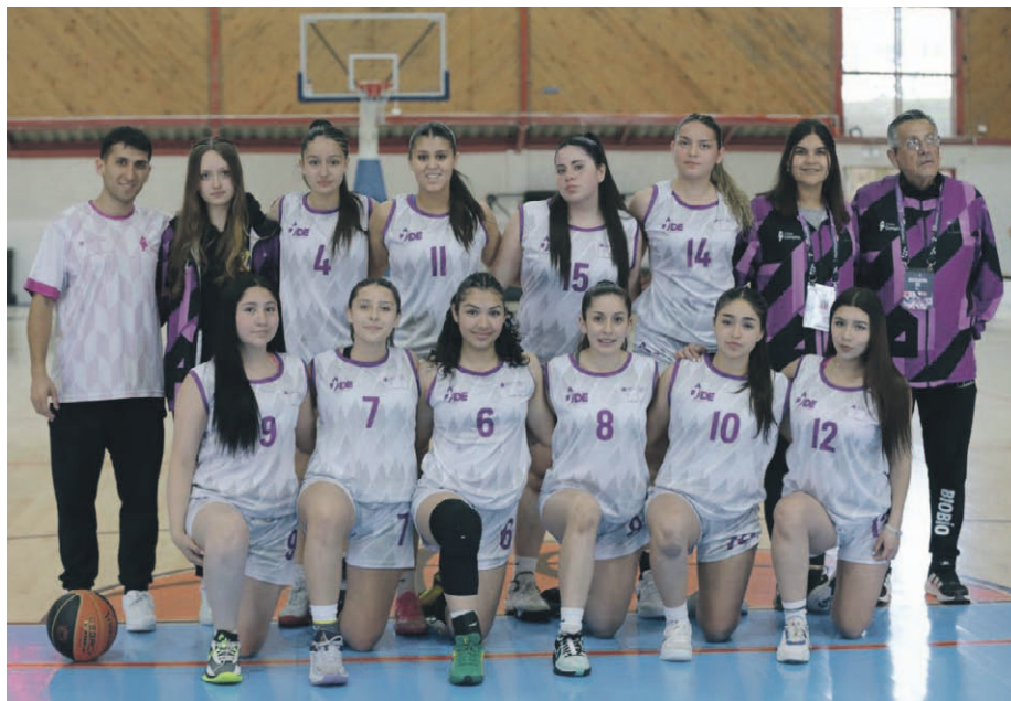
El conjunto de Biobío en básquetbol logró avanzar a la ronda de los cuatro mejores en el Gimnasio Coquimbo.

Tras intensos días de competencia en la fase de grupos, ya están definidos los elencos que buscarán la gloria en las semifinales programadas para este lunes, cuyos ganadores disputarán el título nacional el martes. El ambiente deportivo y la alta participación de