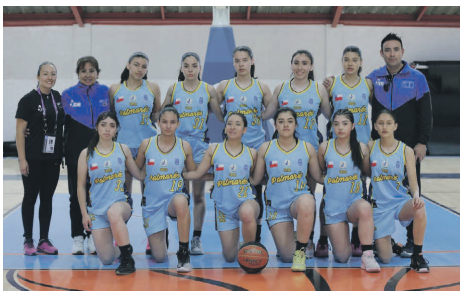
Metropolitana saldrá al paso de Biobío en su camino a la final nacional Juvenil de los Juegos Deportivos Escolares que este martes bajarán el telón en la conurbación.