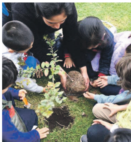
Un total de 30 árboles nativos plantaron niños y adultos.

En cuanto a los árboles plantados, la encargada del jardín indicó que estas