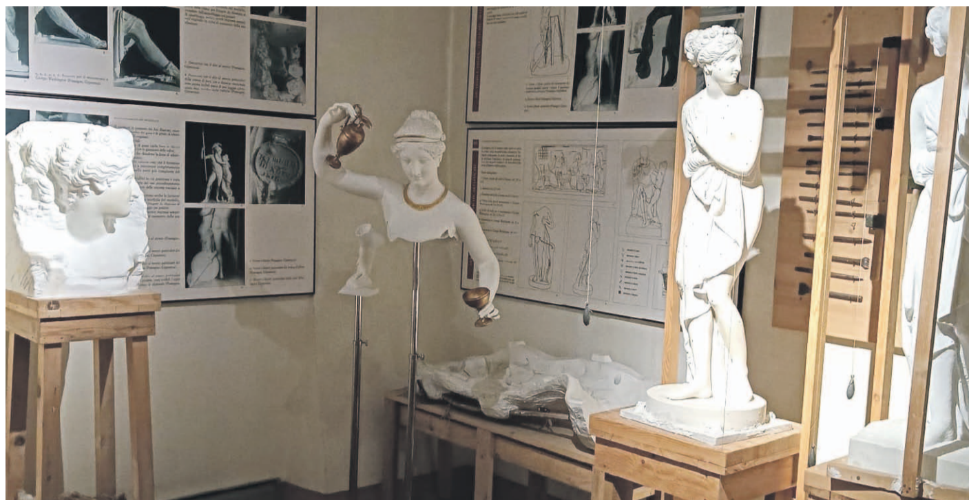
En la imagen se aprecia la estatua de Venus Itálica en el taller de Antonio Canova en Italia, que en el Museo al Aire Libre es la primera instalada en la avenida Francisco de Aguirre, de oriente a poniente.

De la misma forma, se trasladó posteriormente a Roma, en donde se encuentra un taller desde donde salieron 18 estatuas para La Serena, desde la escuela de Antonio Canova, "el escultor más importante neoclásico de los últimos 300 años. ¿Por qué nombro a Canova? Porque hay algunas copias que son réplicas de acá. Tuve que ir a su casa museo en un pueblito en los Alpes italianos. También tuve que ir a Carrara, la ciudad del mármol e ingresé a las cavas o cuevas de mármol, a donde iba Miguel Ángel para hacer el David o las obras que quería el Papa", señala Sabando.