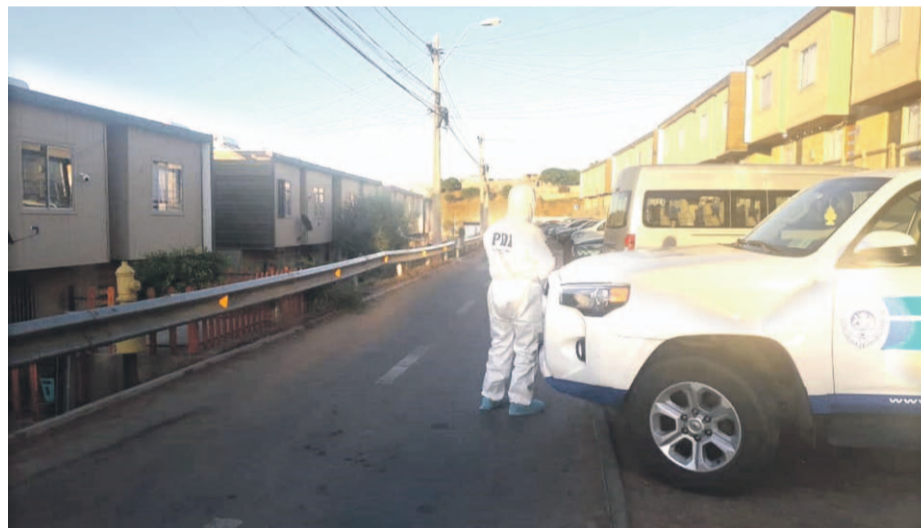
La Brigada de Homicidios de la PDI La Serena concurrió hasta el condominio Terrazas del Valle para investigar el femicidio.

Durante la madrugada de este martes ocurrió un nuevo femicidio en la comuna de Ovalle, cuando un hombre de 32 años de edad dio muerte a su pareja en el baño del domicilio que ambos compartían. El crimen fue alertado por los hijos, lo que permitió la llegada de Carabineros y la detención del sujeto. La formalización por parte de la Fiscalía se realizará este viernes 29 de noviembre, ya que se solicitó una ampliación de la detención por las diligencias que aún están pendientes.