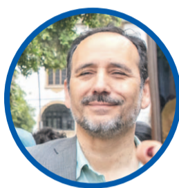
Daniel Núñez SENADOR PC

“Hay un porcentaje bastante marginal a favor de las fuerzas del oficialismo, y que esto pone las cosas respecto a 2025, que es otra batalla, otro desafío”