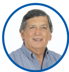
Lautaro Carmona PRESIDENTE DEL PC

“Por otro lado, Cristóbal Juliá tuvo habilidad para mostrarse como una figura independiente, desmarcándose de los partidos de derecha. Es digno