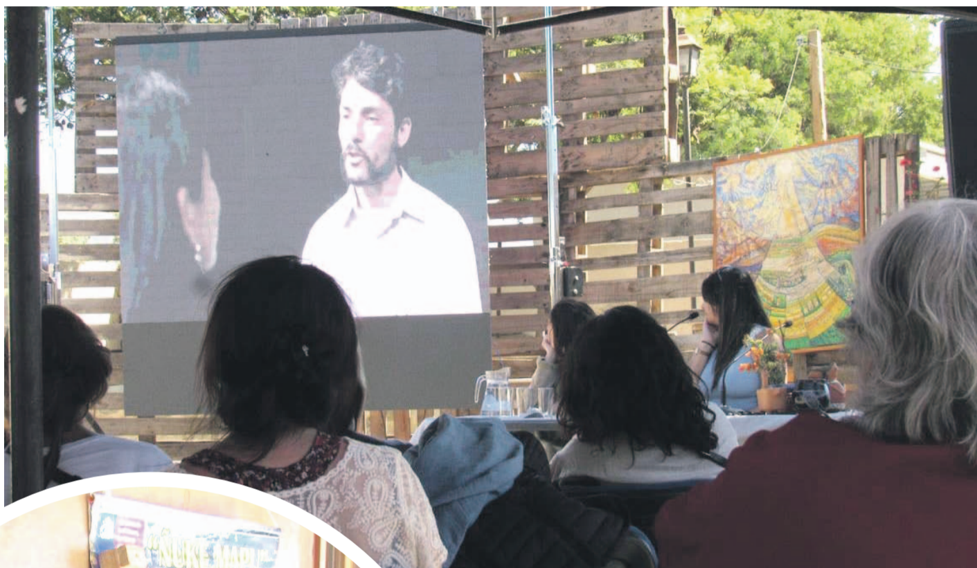
Diferentes actividades contempló el encuentro.