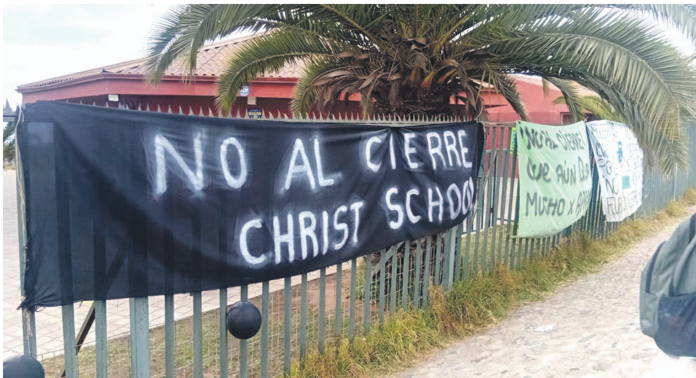
Esta semana los alumnos del Colegio Christ School se tomaron el establecimiento exigiendo respuestas claras de las autoridades para evitar su cierre.

En paralelo a la solicitud de reconocimiento, el seremi destacó el trabajo de la autoridad para asegurar la continuidad educativa de los estudiantes del Christ School, indicando que se