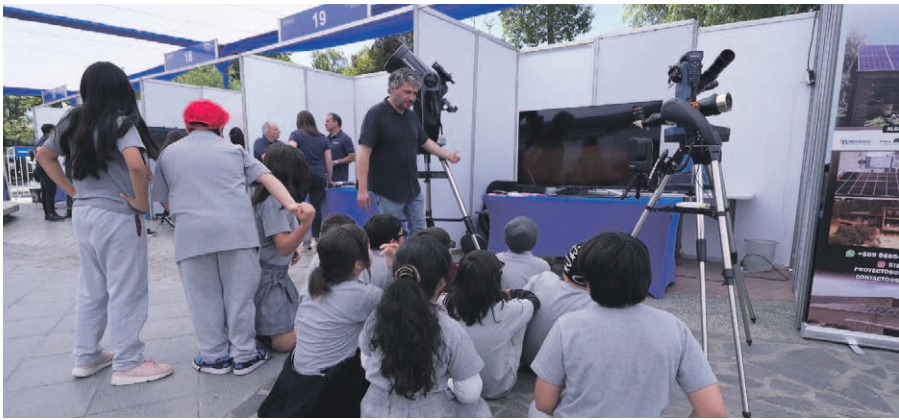
Taller de observación astronómica para niños y niñas.