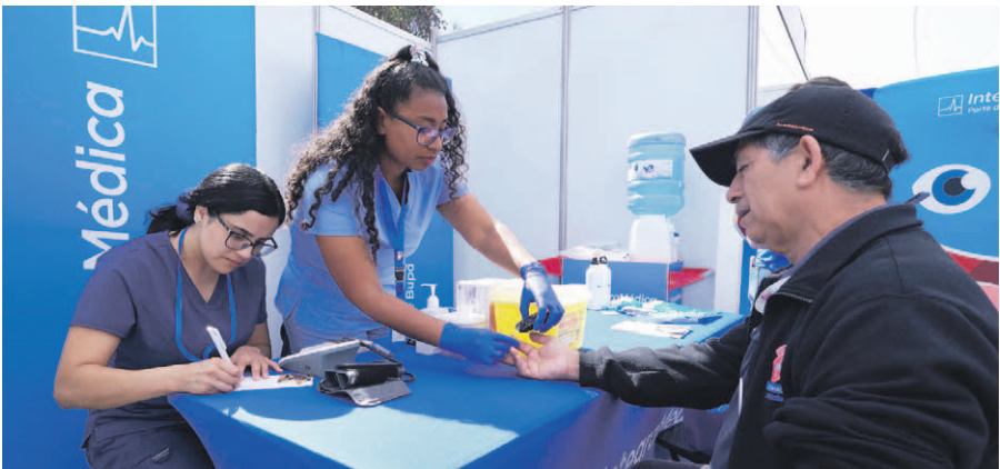
Examen preventivo de salud.