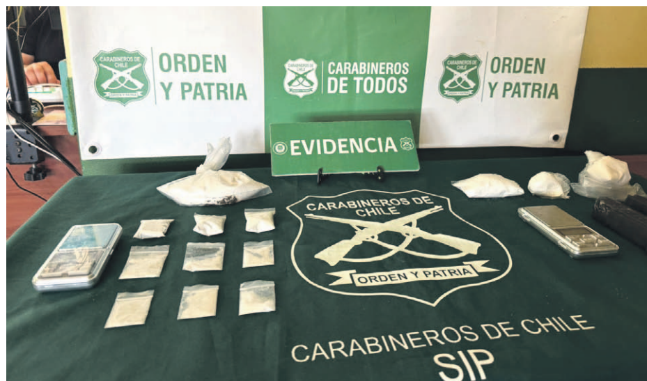
Cocaína, cargadores de pistola y un vehículo fueron decomisados al momento de detener a los delincuentes.