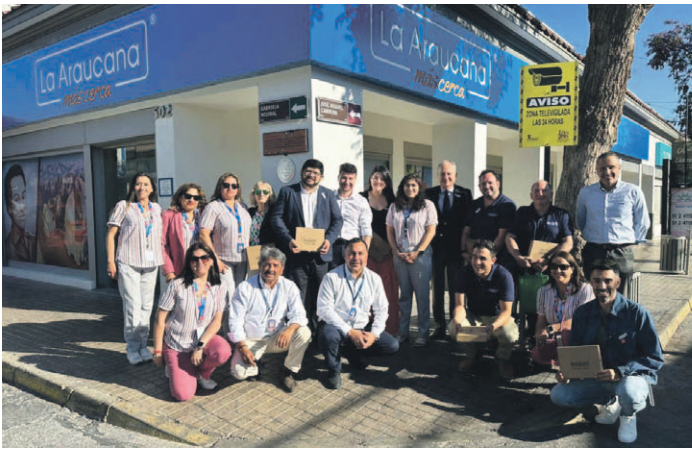
Inauguración de sucursal Vicuña: Directorio y equipo de La Araucana.