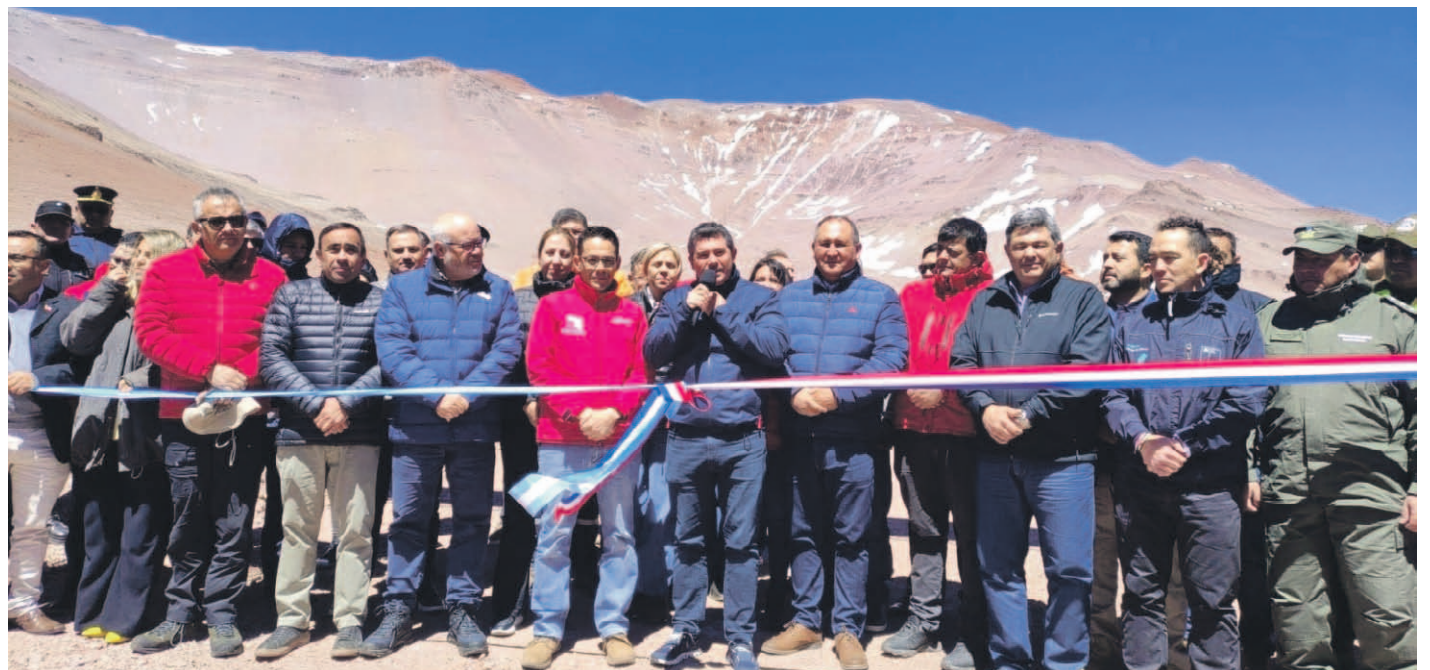
Autoridades de la región y de San Juan dieron el vamos a la apertura del paso de Agua Negra para la temporada estival 2025-2026.

“Esperamos que ojalá hasta mayo o junio podamos tener abierto el paso, que permita que turistas de toda Argentina, no solo de San Juan, sino