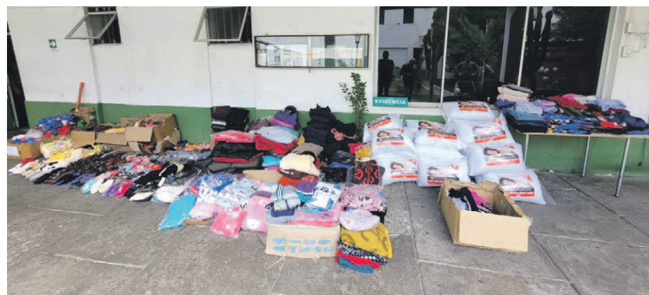
Carabineros recuperó la totalidad de la mercadería robada en dos allanamientos consecutivos realizados en domicilios vinculados en el caso.

Ahí, la SIP detuvo a un hombre de 46 años por receptación. “Con antecedentes sólidos, el día 24 de noviembre