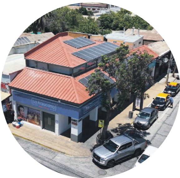
Nueva sucursal de Vicuña, con murales alusivos al patrimonio local, espacios para la comunidad y foco en eficiencia energética.

Junto con la Plaza del Bienestar, La Araucana inauguró oficialmente su nueva sucursal en Vicuña, un espacio de 150 m² completamente renovado y diseñado bajo el modelo de atención Más Cerca, centrado en espacios accesibles y sostenibles.