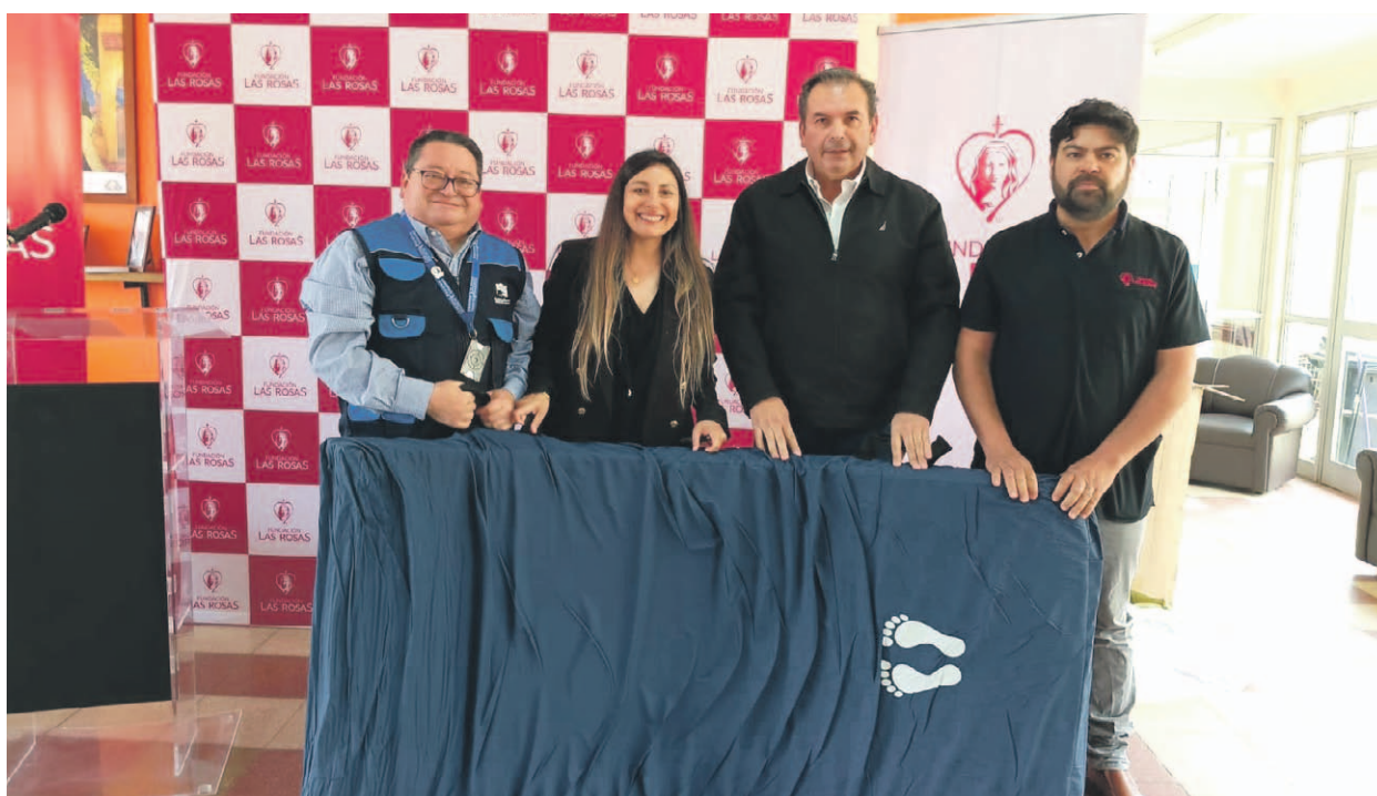
En la ceremonia fueron recibidos los 28 colchones para los residentes del hogar La Visitación de María de la Fundación Las Rosas.

Se trata de la renovación de 28 colchones destinados a los residentes del hogar La Visitación de María en La Serena, pensados para entregar mayor confort, higiene y calidad de vida a personas con movilidad reducida. Durante la ceremonia, representantes de la institución explicaron la relevancia de esta ayuda y el impacto que tiene entre los adultos mayores.