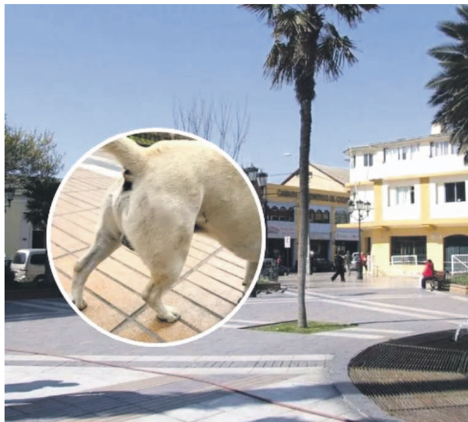
El hecho habría ocurrido en la plaza de armas de Coquimbo.

Desde la administración comunal reafirmaron su compromiso con el bienestar animal y llamaron a la comunidad a denunciar formalmente cualquier acto que vulnere la tenencia responsable de mascotas.