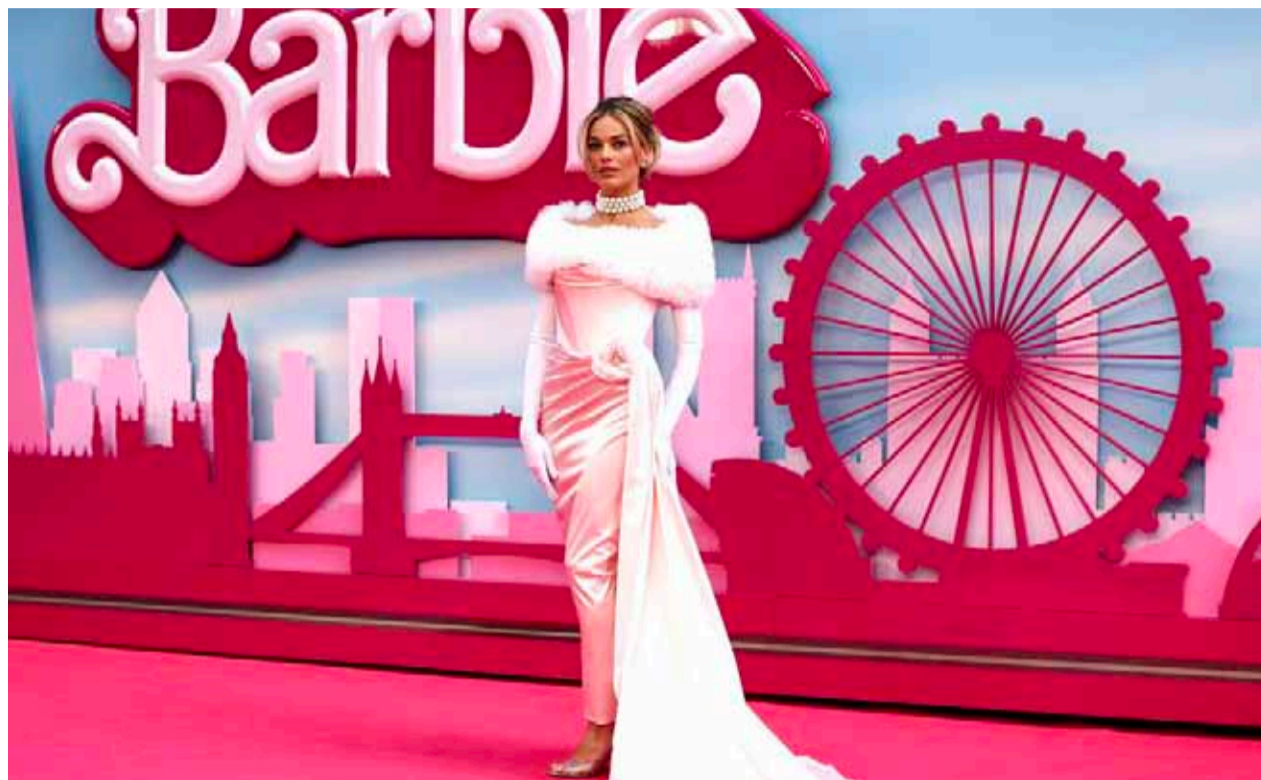
Margot Robbie, protagonista de 'Barbie' es una de las favoritas a mejor actriz en los próximos Óscar.