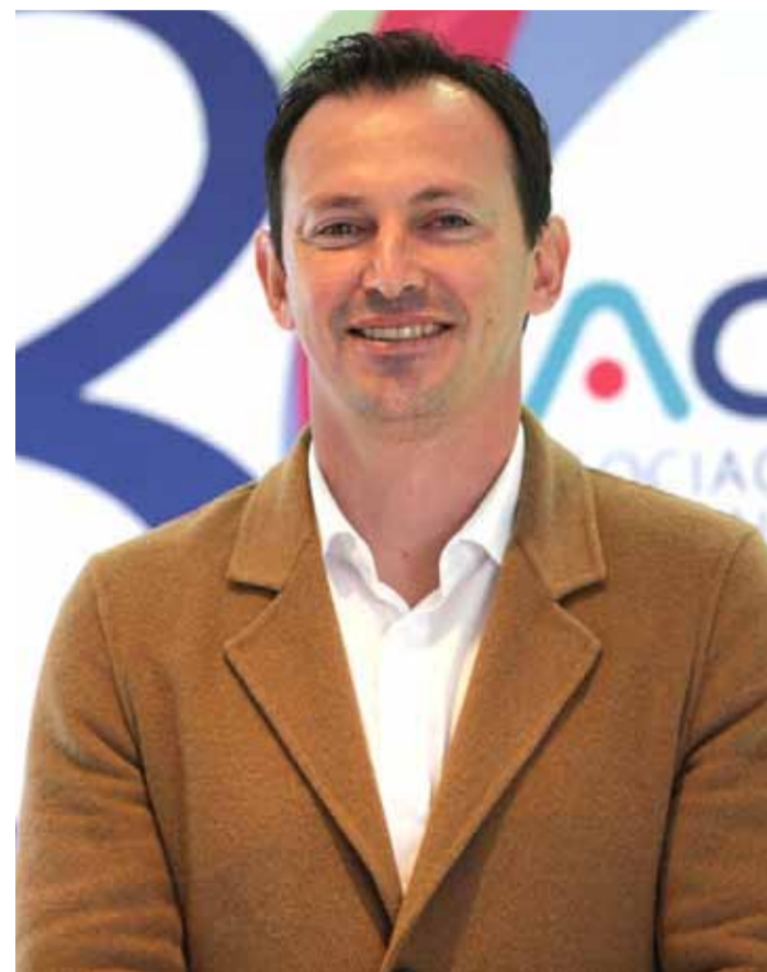
El diputado Cifuentes y el alcalde Ali Manouchehri se enfrentaron a través de la plataforma X.