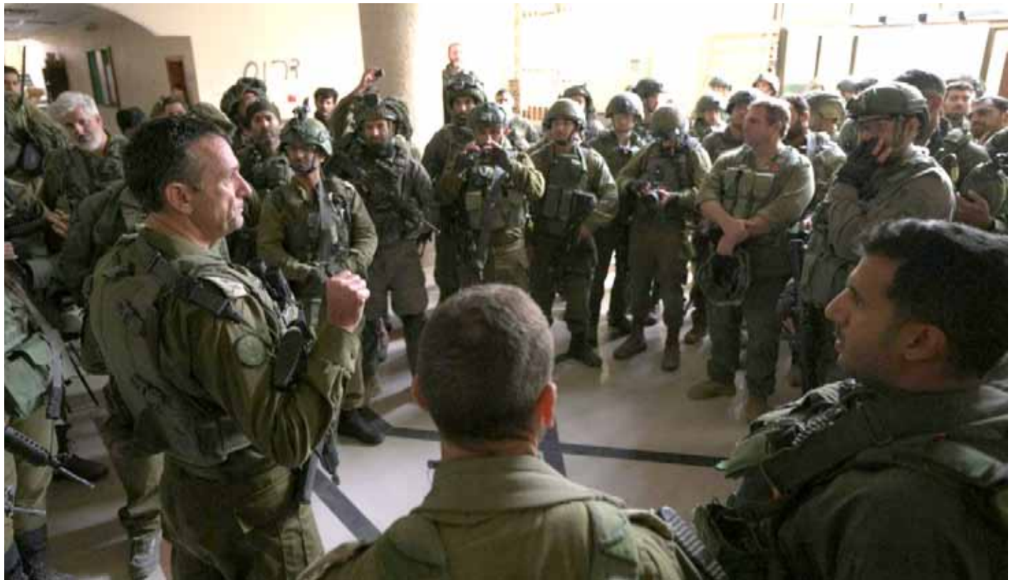
Durante estos días, tropas del ejército israelí han intensificado sus ataques en el sur de la Franja de Gaza.

Esto eleva a 495 el número de soldados israelíes muertos desde que estalló la guerra, de los cuales 161 perdieron la vida en la incursión terrestre a la Franja, que se inició el 27 de octubre.