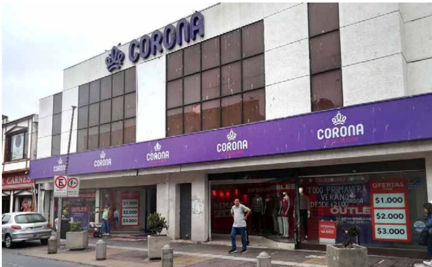
Tras el robo, la administración de la tienda evitó referirse al hecho.

Finalmente, la tienda "King Miami Outlet" cerró sus puertas en Coquimbo y se retiró, tal como lo anunció previamente el goleador luego de sus primeras semanas de funcionamiento.