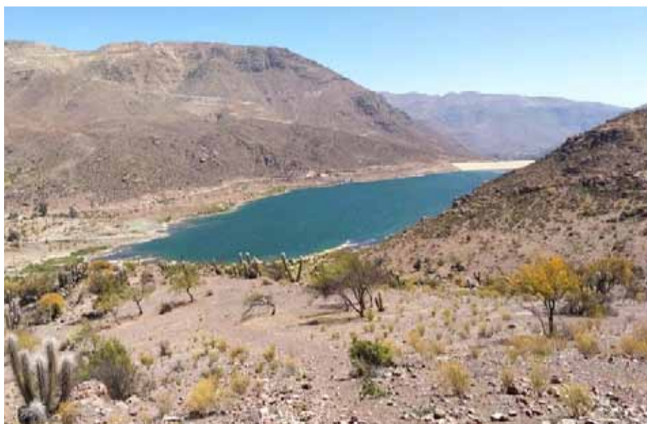
El embalse El Bato hoy presenta un 45% de agua acumulada. Esto, gracias a la prorrata entre 12 a 13% que es entregada a los regantes.

Si bien reconocen que este año están más preparados para enfrentar la escasez hídrica gracias a las medidas de racionamiento que han tomado con la entrega de agua desde el embalse El Bato, la situación sigue siendo crítica, razón por la cual, varios han preferido vender sus tierras para levantar parcelas de agrado.