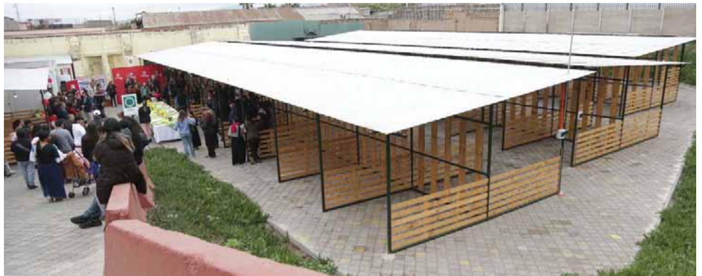
Listas para su inauguración el próximo 8 de enero, se encuentran las instalaciones del mercado central de La Serena.

De esta manera, dicho espacio quedó a disposición de la Federación de Trabajadoras y Trabajadores Independientes "Siempre Unidos", agrupación que se compone de 115 ex comerciantes ambulantes que anteriormente vendían sus productos en las calles del centro de La Serena.