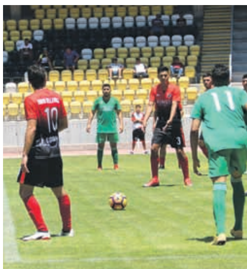
La actividad amateur está en pleno en la temporada de verano en la región de Coquimbo.

El cuadro de David Arellano o Estudiantes Unidos, se sumará a la tercera fase del Campeonato Regional de Clubes Campeones y