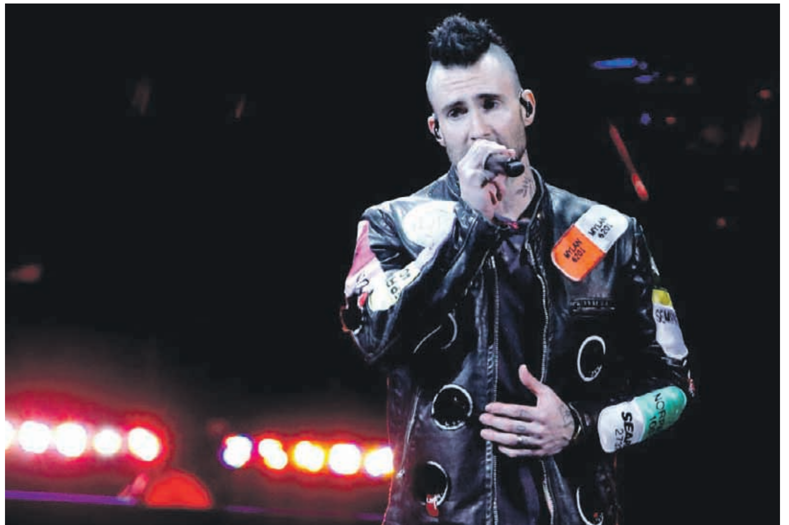
Anoche la Quinta Vergara se rindió al talento y la potencia de la banda estadounidense Maroon 5, la carta pop anglo de la quinta jornada del Festival de Viña del Mar 2020. Los liderados por Adam Levine debutaron en grande en el certamen más importante de Latinoamérica. 29

Luego de dos días de postergación, ayer finalmente se dio inicio al juicio oral, en el que se acusa a tres imputados por los delitos reiterados de estafa, loteo y venta irregular de terrenos. 4-5