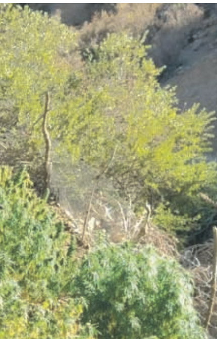
Más de 20 mil plantas de marihuana fueron halladas en las quebradas de las provincias de Limarí y Choapa.

“Es importante para el éxito de estos servicios, que está implementando la institución, el apoyo de la comunidad, nosotros necesitamos que la comunidad nos entregue información y confíen en Carabineros de Chile”,