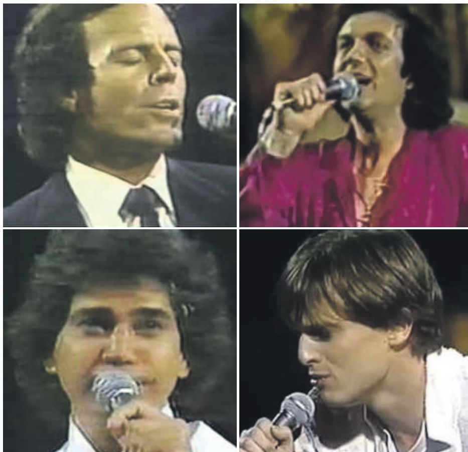
En la imagen, fotografías del recuerdo de cuatro grandes de la música.

39 años han pasado de la que ha sido calificada como la mejor edición del certamen.