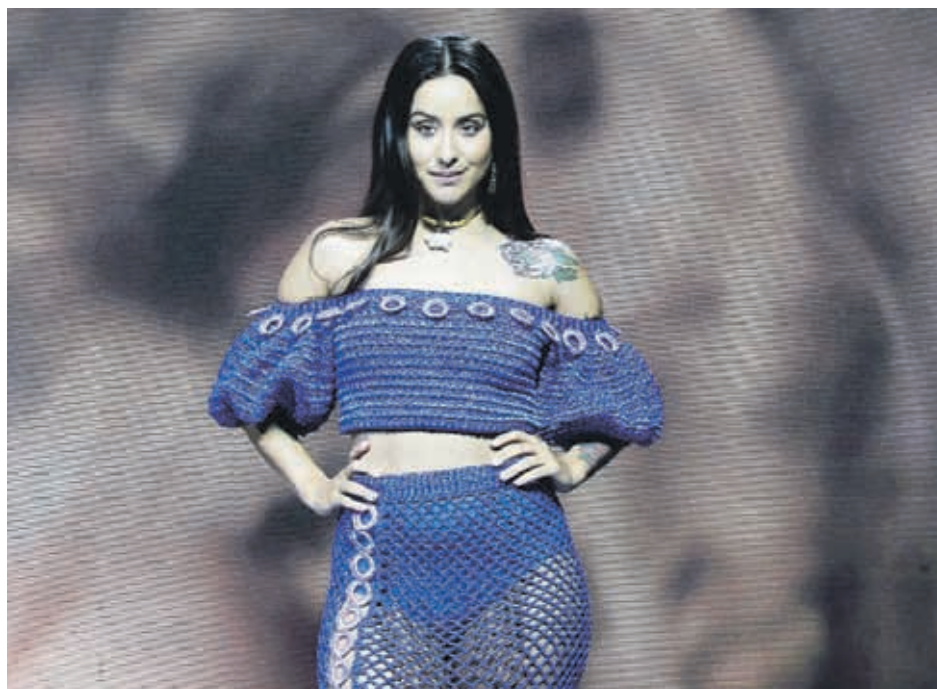
La artista se encuentra en plena promoción de su último single “Tiene sabor”, canción que promueve el amor propio.

hacer música, esa es mi manera de comunicar. Profundamente creo que ese es el lugar donde me siento más cómoda generando contenido, diálogo y espacios de reflexión. Si bien he construido mi opinión, se hace evidente al escuchar mis canciones y ver la puesta en escena”.