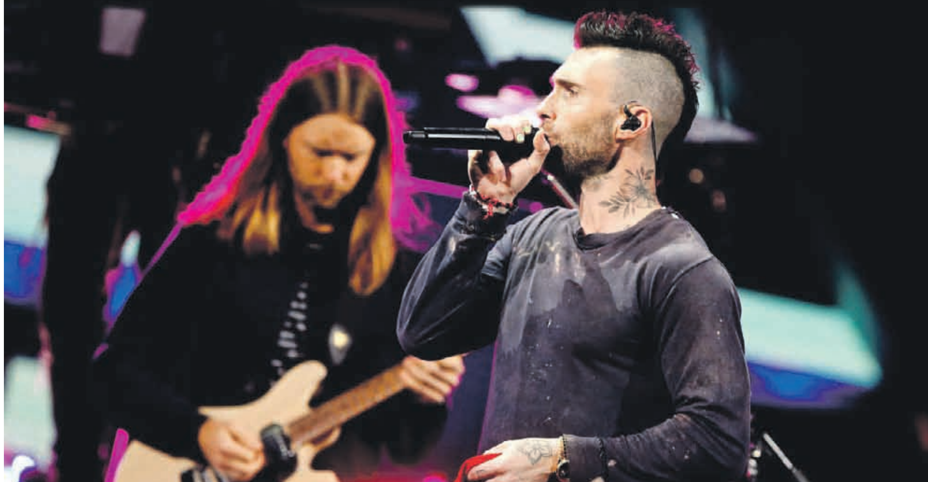
Adam Levine sorprendió con un nuevo look a la Quinta Vergara, plato fuerte de la noche anglo.