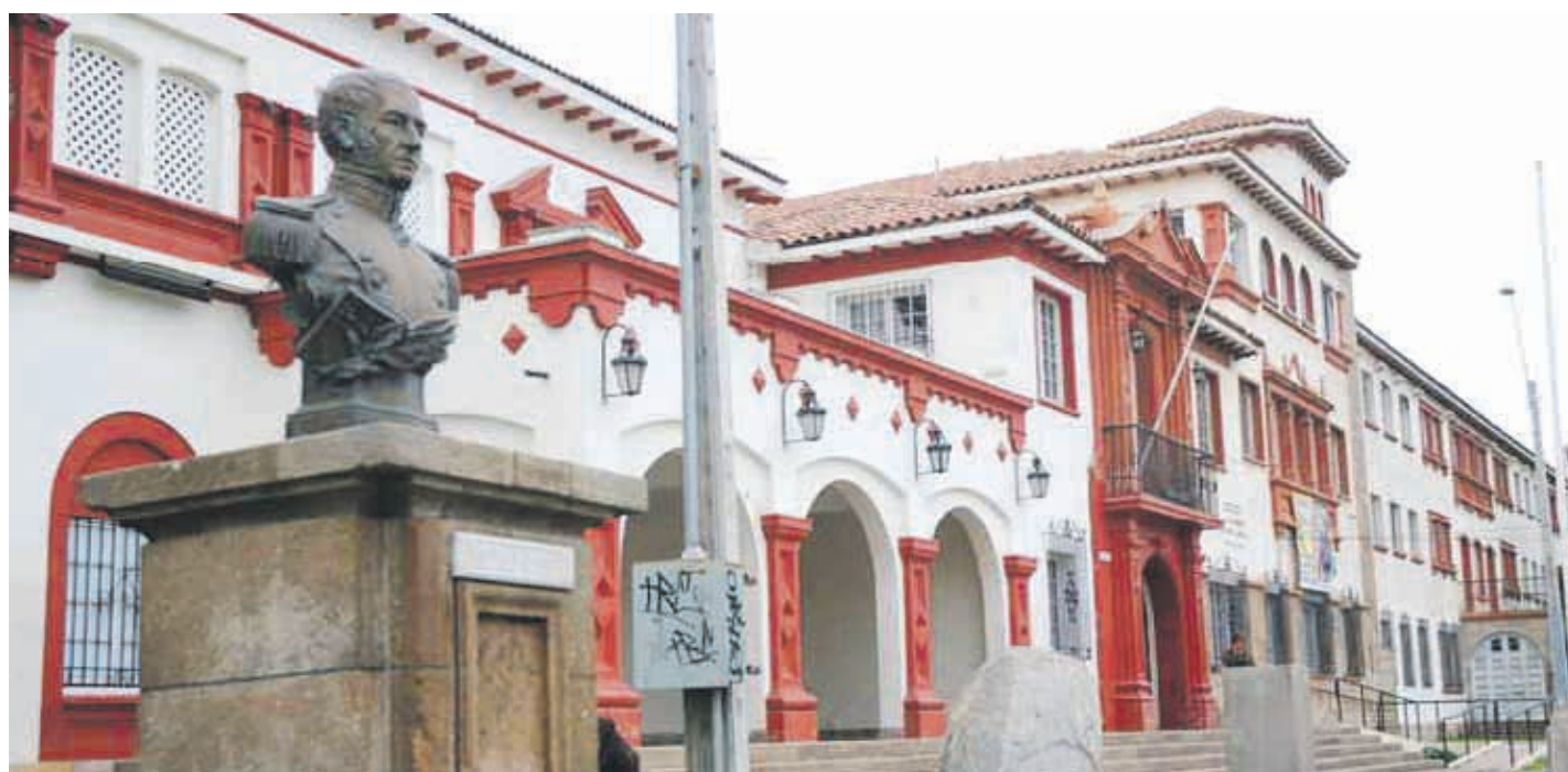
El Liceo Gregorio Cordovéz en 2012 se convirtió en Liceo Bicentenario, instancia donde el establecimiento se renovó para mejorar la calidad de su educación, abriéndose a la comunidad educativa para mantener vivo el espíritu liceano histórico y patrimonial.

con constantes ensayos PSU, los que se van revisando y explicando.