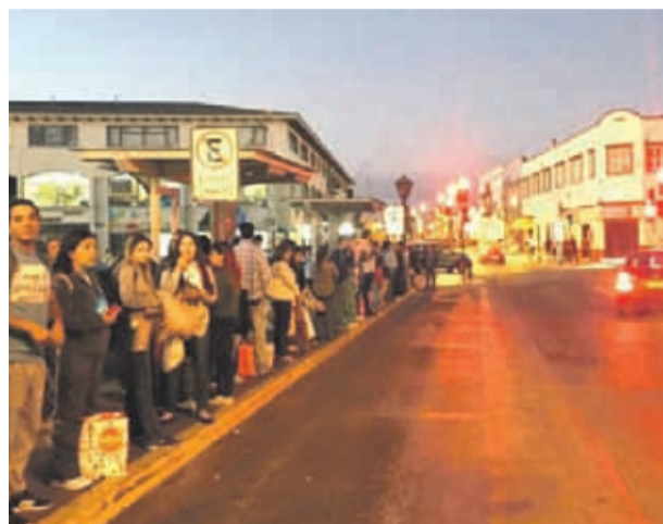
La imagen fue captada por un reportero ciudadano que denunció la problemática.

deben asegurar cantidad de vehículos, recorrido, horario, precio y un mínimo de vehículos en ruta. La Seremía debería fiscalizar y retirar el permiso