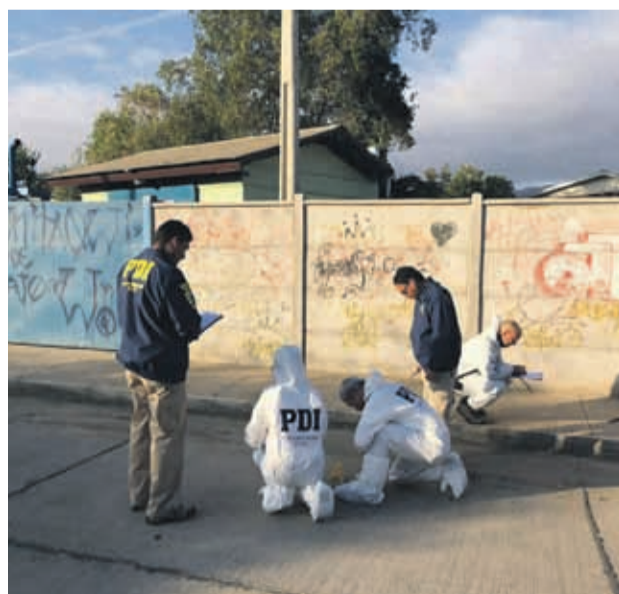
Funcionarios de la PDI de Ovalle investigaban el hecho ocurrido durante la tarde de ayer en Punitaqui

Respecto a otras horas del día, todo está en manos de las líneas. “En este sentido, nosotros estamos constantemente trabajando con los colectiveros, para que se mantengan trabajando porque entendemos que todavía hay gente que necesita llegar a sus hogares. Insisto, es un tema en el que se están haciendo cosas para evitar estas largas filas”, expresó. 46011