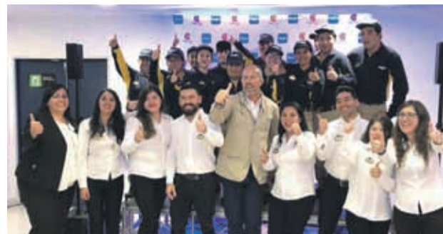
Todo el staff de Cine Hoyts participó en la actividad inaugural esta semana

“Este martes le dimos la bienvenida a los chicos de Ovalle que van a trabajar con nosotros en las salas, y para ello los invitamos junto a sus familias, además de las autoridades civiles de la comuna, y de todos quienes participaron finalmente en el proyecto”.