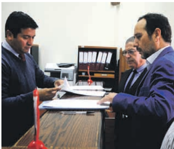
Las autoridades presentaron ante la Contraloría los requerimientos de una polémica medida que ha causado debate entre los chilenos.