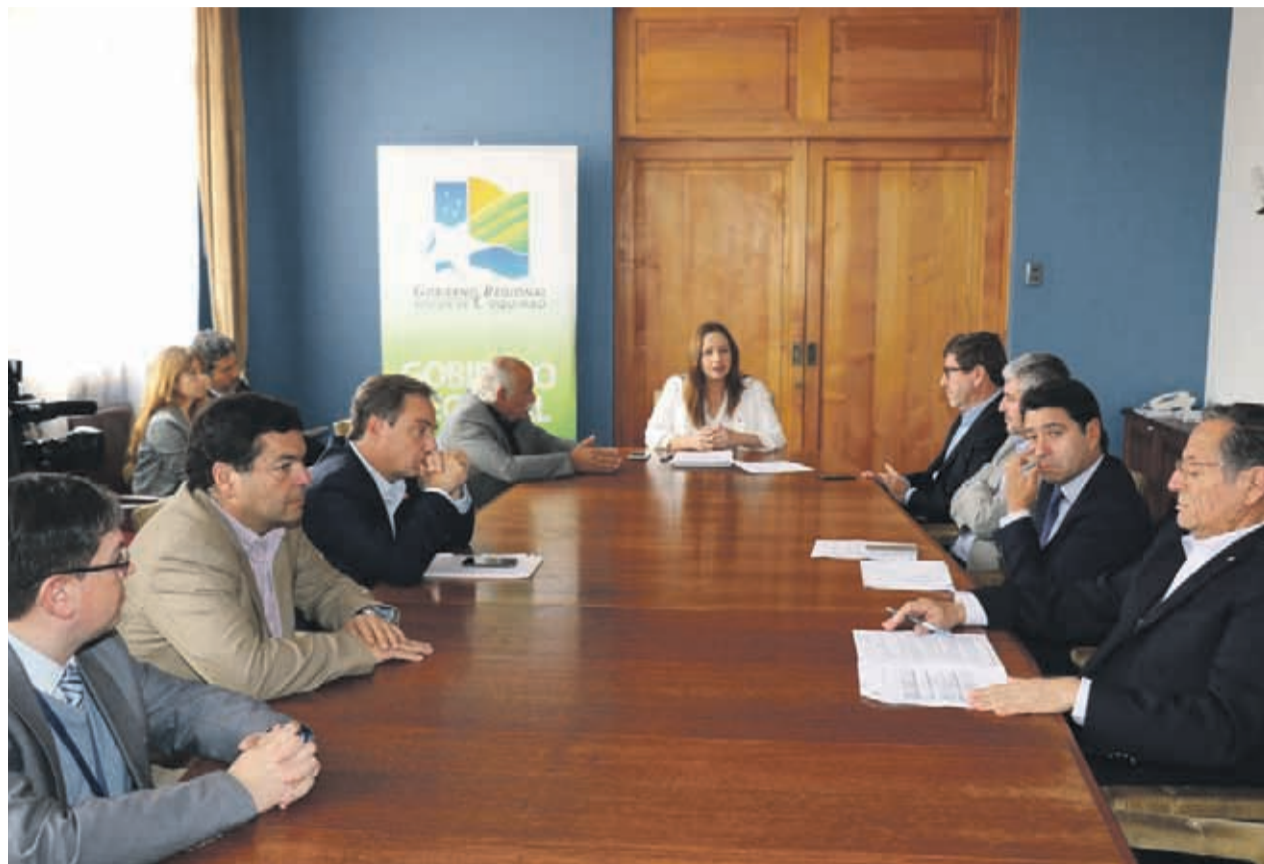
Las autoridades y empresarios regionales valoraron el hito para la región, que impulsará inversiones y desarrollo en la zona.