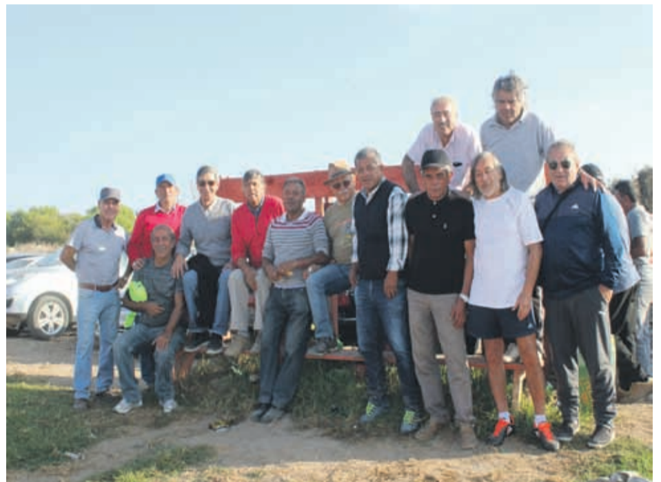
Compartiendo luego del partido, los cracks de la barra de Panificadoras posaron para la cámara del Suplemento Amateur de Diario el Día