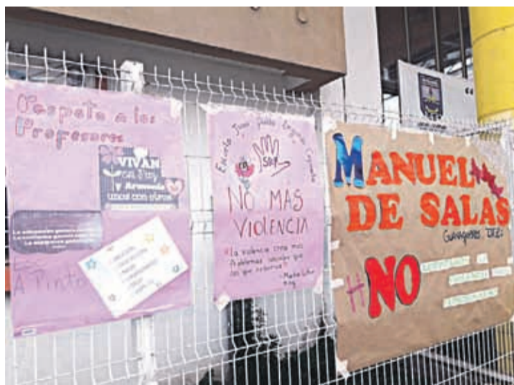
Otros establecimientos educacionales pegaron pancartas afuera del colegio en apoyo al personal docente.