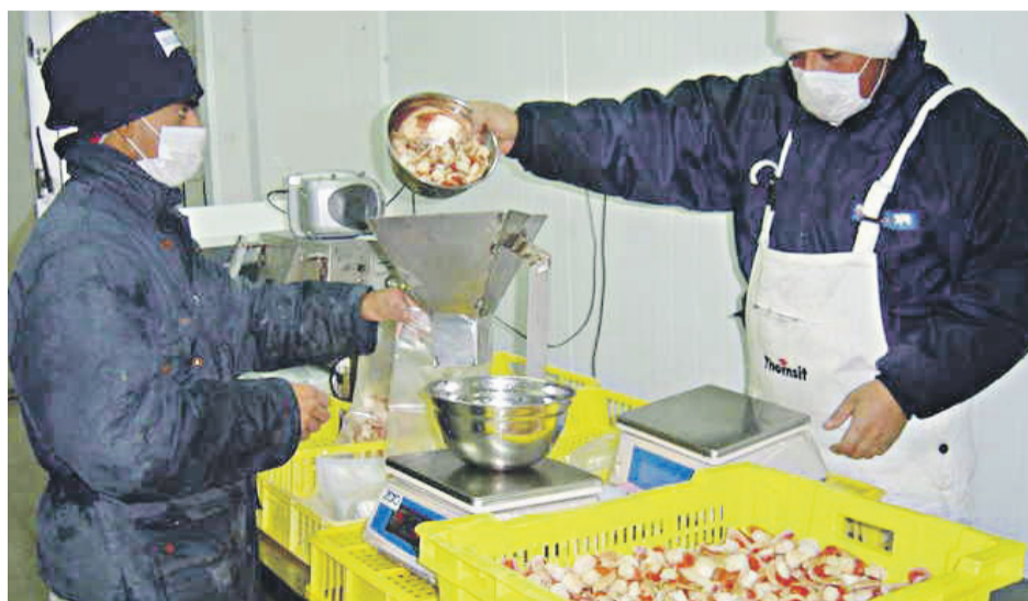
En los últimos años, la industria del ostión se ha recuperado favorablemente.

particularmente afectado en los últimos años”, dijo Vásquez.