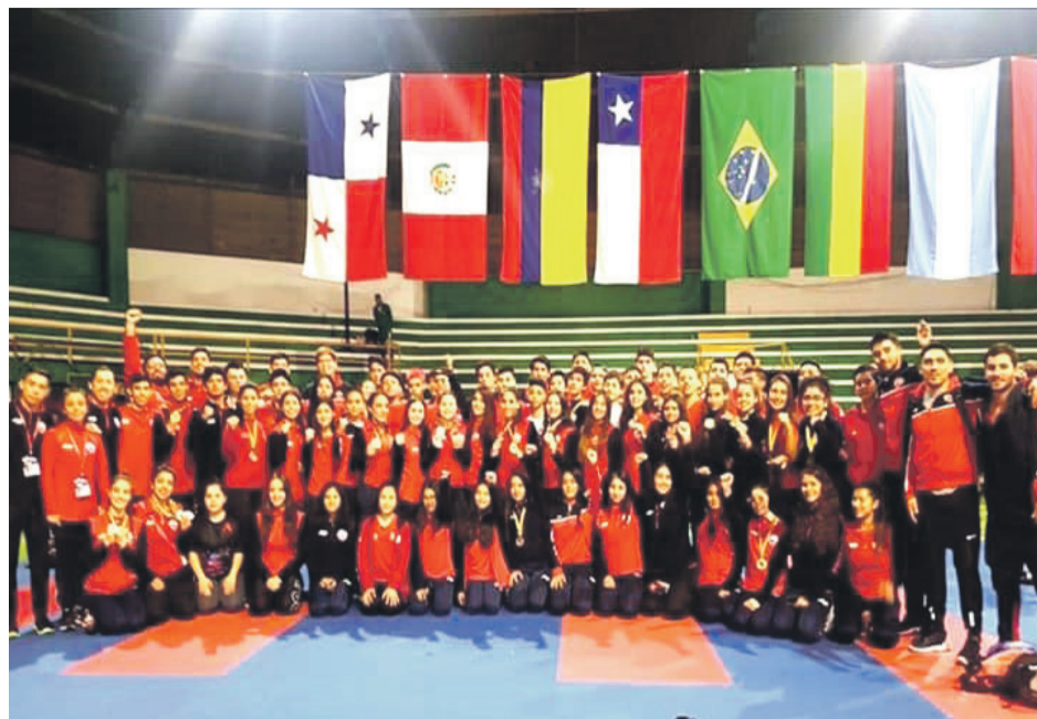
La presencia de la región en la selección en el Sudamericano celebrado en Santa Cruz, Bolivia.