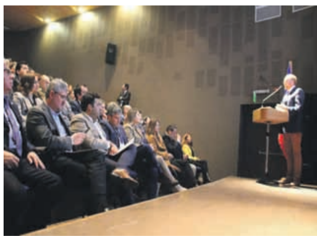
Este lunes, la Secretaría Regional Ministerial de Obras Públicas de Coquimbo llevó adelante la cuenta pública correspondiente al período 2018 y lo que va de 2019 en la región.

es suplir esos trayectos. "El plan es que al menos en un comienzo, el tren llegue hasta Marquesa. Es un proyecto importante que debemos fortalecer", remató.