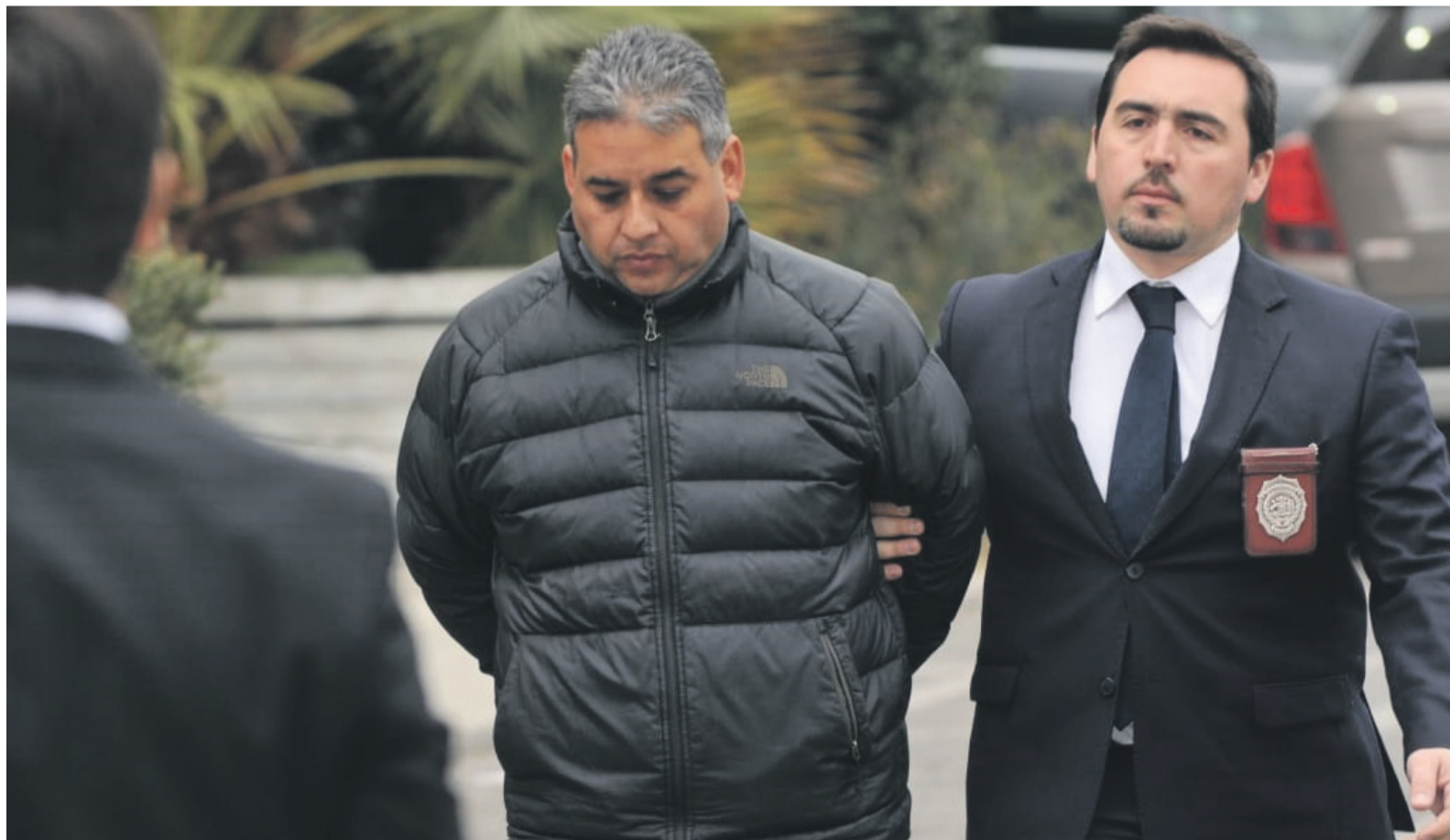
En la imagen, siendo trasladado por personal de la PDI luego de su detención para ser formalizado.

Conforme a información otorgada por las autoridades, los detenidos estaban concertados para gestionar “cartas de invitación para extranjeros” ideológicamente falsas, a fin de que estos migrantes pudieran obtener visa de turismo para ingresar a Chile, las cuales argumentaban que se trataban de empresarios chinos que viajaban para gestiones de negocios.