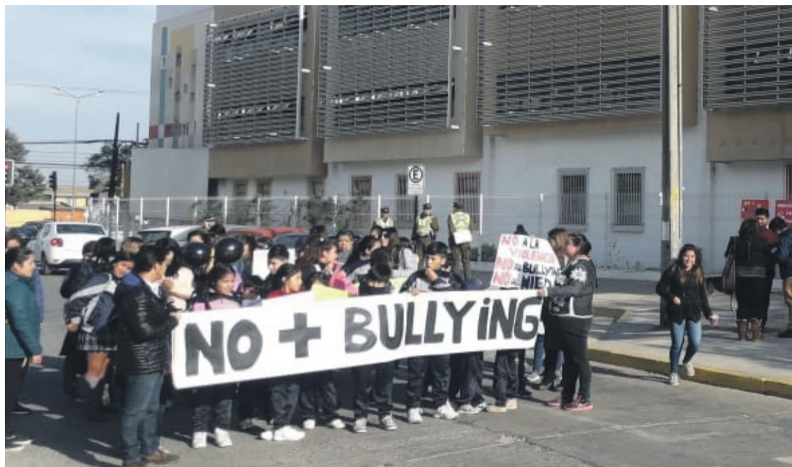
Apoderados y alumnos del recinto educacional realizaron en la mañana de ayer lunes una protesta pacífica en el frontis del recinto.

“En el curso de mi hijo hay un niño que tiene problemas y llevamos varios días pidiendo soluciones para que lo ayuden, no que lo expulsen, si no que le brinden