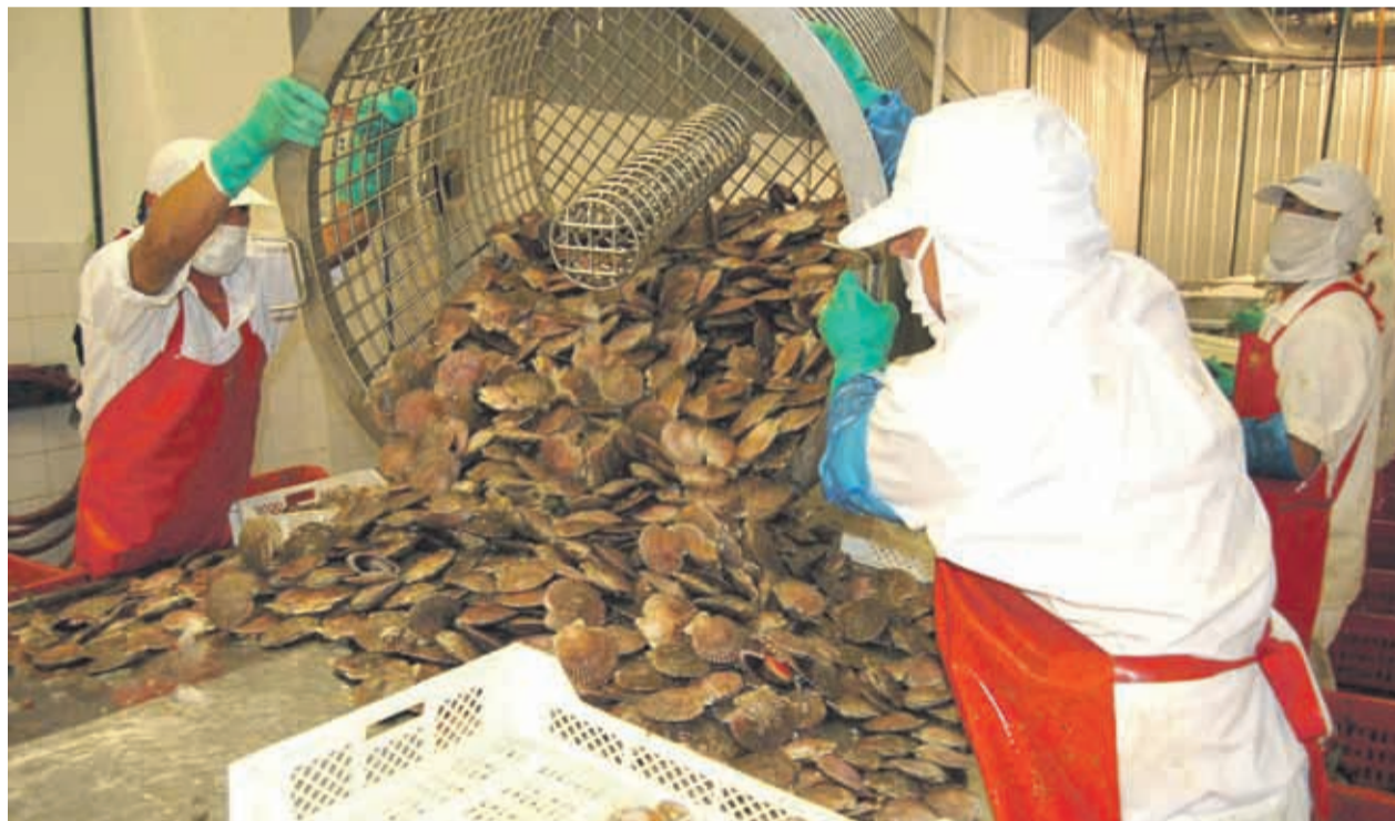
Las bahías de Tongoy y Guanaqueros concentran parte importante de la producción nacional.

“La recuperación de las exportaciones del ostión son una muy buena noticia para un sector importante de la economía local que se ha visto