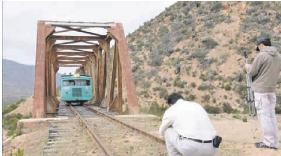
Siguiendo la línea de los proyectos de transportes y en particular del tranvía, Herman aclaró que se trata de un proyecto importante que hay que potenciar

En efecto, Herman adelantó que el MOP está ad portas de firmar un convenio con la Empresa de Transporte Ferroviario, Ferronor, para apoyar en la mantención de la ruta ferroviaria. "Estamos viendo de qué manera nos podemos transportar no solamente en la zona urbana, sino que también en la interurbana. En la región tenemos una cantidad de rieles y trazados ferroviarios al interior y hay que usarlos", dijo, y agregó que hay sólo dos sectores en donde se cortó la ruta ferroviaria hacia el valle de Elqui: en el sector de Puclaro y Vicuña, por lo que la idea