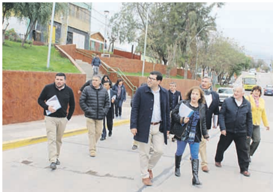
Los integrantes del Core valoraron el trabajo realizado por el municipio de Monte Patria que logró el financiamiento de 4 proyectos por un monto de $2.094 millones.

La comuna de Monte Patria, logró un financiamiento importante de 4 proyectos aprobados, por un monto total a ejecutar de $2.094 millones, iniciativas que corresponden