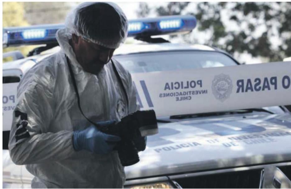
La PDI se encuentra investigando el delito de lesiones con arma de fuego, del que fue víctima un hombre en la parte alta de La Serena en la población 17 de Septiembre.

Cerca de las 01:00 horas de este lunes, personal del SAMU por un llamado de emergencias se trasladó hacia el sector de la 17 de Septiembre en la comuna