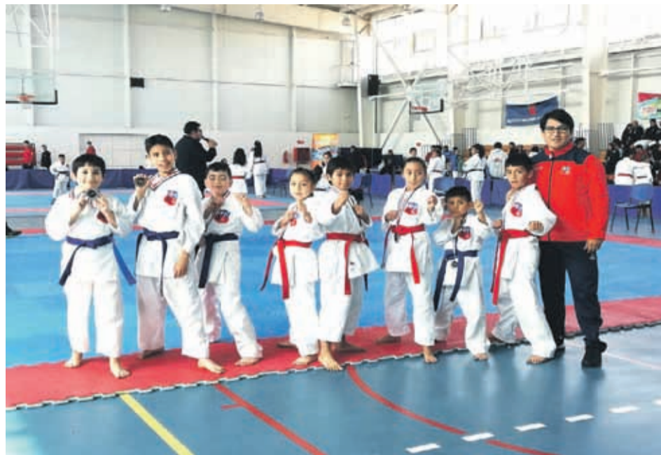
Los chicos del club Salud y Bienestar se hicieron presentes en el encuentro de Copiapó.