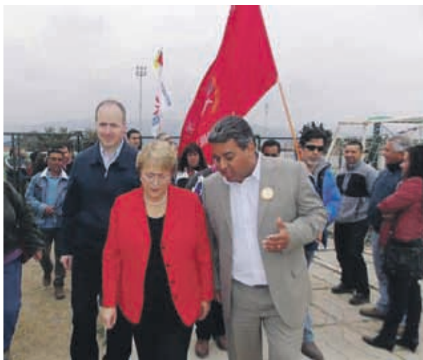
Junto a la ex Presidenta de la República Michelle Bachelet, durante su segundo periodo y en visita a la región. Trigo era el anfitrión de la máxima autoridad

Cuando dejó el cargo en el 2018, para muchos, en su discurso dejó entrever que volvería. La lectura era que se postularía una vez más para ser alcalde de Illapel.