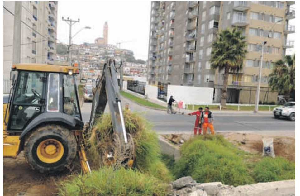
Los trabajos de limpieza con maquinaria apuntaron a despejar ductos y canales