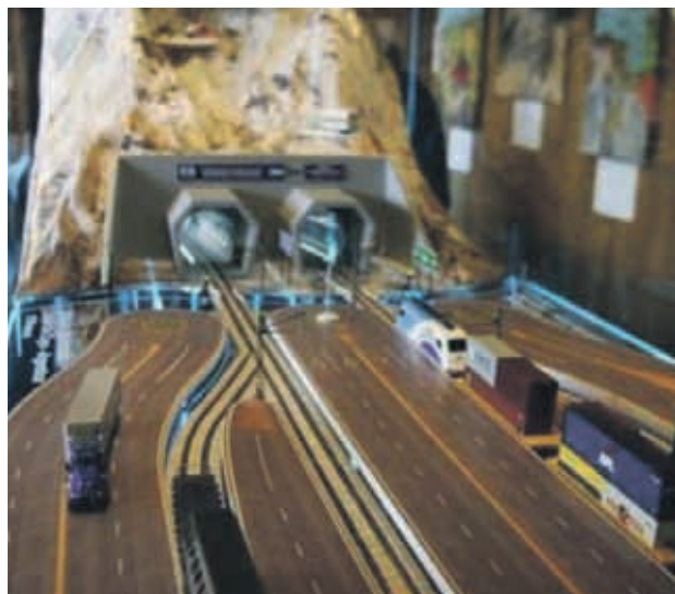
Una maqueta de lo que sería el túnel por el paso de Agua Negra.

La actividad dedicada a la minería del cobre presentó un desempeño positivo en su comparación a doce meses.