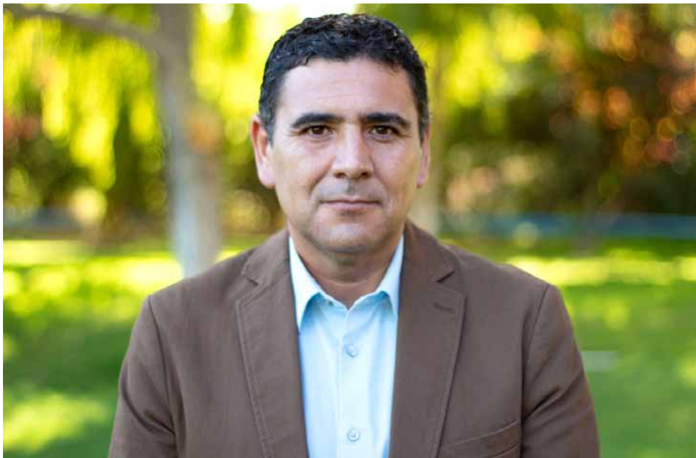
El alcalde de Monte Patria, Cristian Herrera Peña, realizó un balance de los avances y desafíos para su comuna.