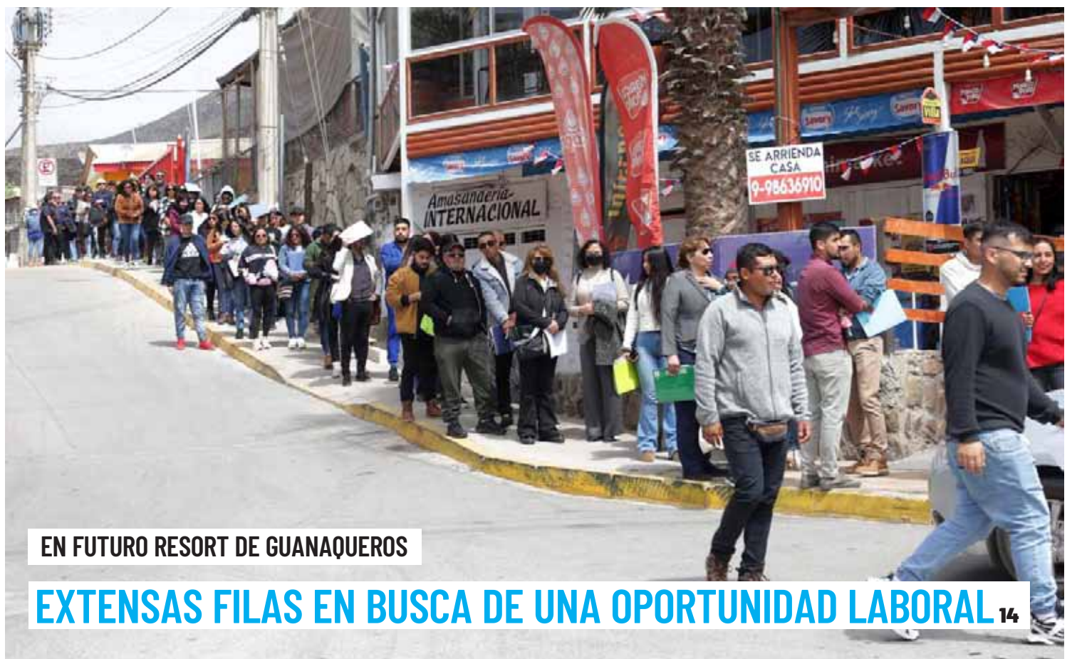
EN FUTURO RESORT DE GUANAQUEROS

Durante los días miércoles, jueves y viernes de la próxima semana, el Presidente llegaría a la Región de Coquimbo, en la que sería su segunda visita oficial. Aunque aún se desconoce su agenda oficial, los ediles dan cuenta de sus expectativas. 4