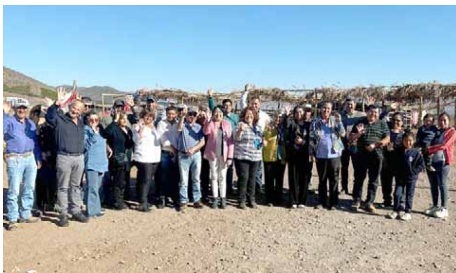
El anuncio del "Plan Sequía" se realizó en la localidad de Canelilla, en la comuna de Ovalle.

Junto a crianceros, agricultores, apicultores y pequeños productores de las zonas rurales de Ovalle, la gobernadora Krist Naranjo dio a conocer este programa que permitirá liberar recursos directos a los 15 municipios.