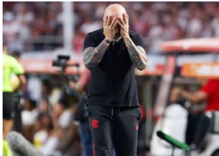
No va más. Jorge Sampaoli no seguirá al mando del club carioca.

El caos con los 'torcedores' del mítico club de Río de Janeiro, quienes no aguantaron los malos resultados y los problemas del cuerpo técnico que encabezaba el trasandino, impulsaron la salida del ex DT de La Roja, quien no dirigiría el parti-