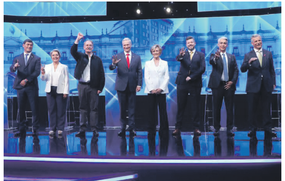
Los candidatos volverán a encontrarse el 4 y 10 de noviembre en los debates de la ARCHI y ANATEL, respectivamente.

En esa línea, aseguró que "los candidatos están empezando a pensar un poco más en la segunda vuelta más que en esta, porque según la encuesta, los datos ya están bastante consolidados. No hay un crecimiento de la candidata del oficialismo pues, si bien, todas las encuestas la dan