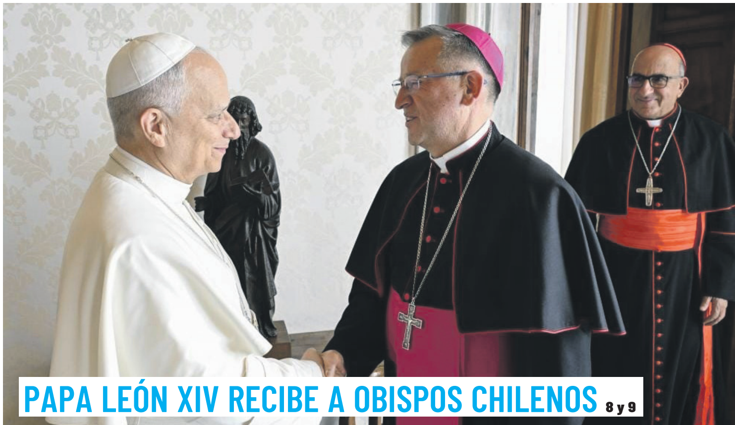
PAPA LEÓN XIV RECIBE A OBISPOS CHILENOS 8 y 9