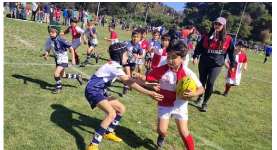
CLUB SAN BARTOLOMÉ