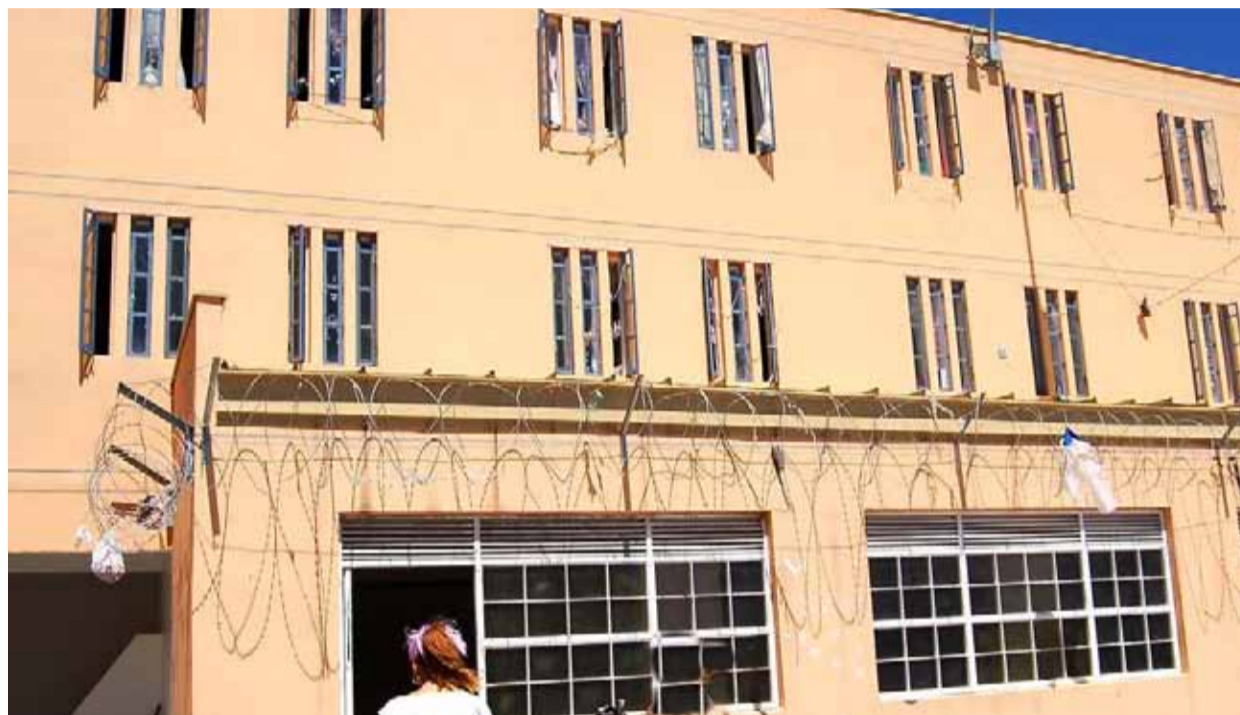
Dos reclusos de Huachalalume presentaron una querrela en contra de la alcaide del recinto, pues la acusan de desobedecer órdenes del tribunal y de apremios ilegítimos.

Según el profesional sus representados, un hombre y una mujer, en