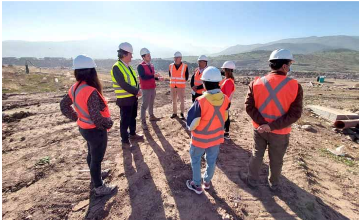
La Región de Coquimbo carece, hasta el día de hoy, de un centro de manejo de residuos propiamente tal.