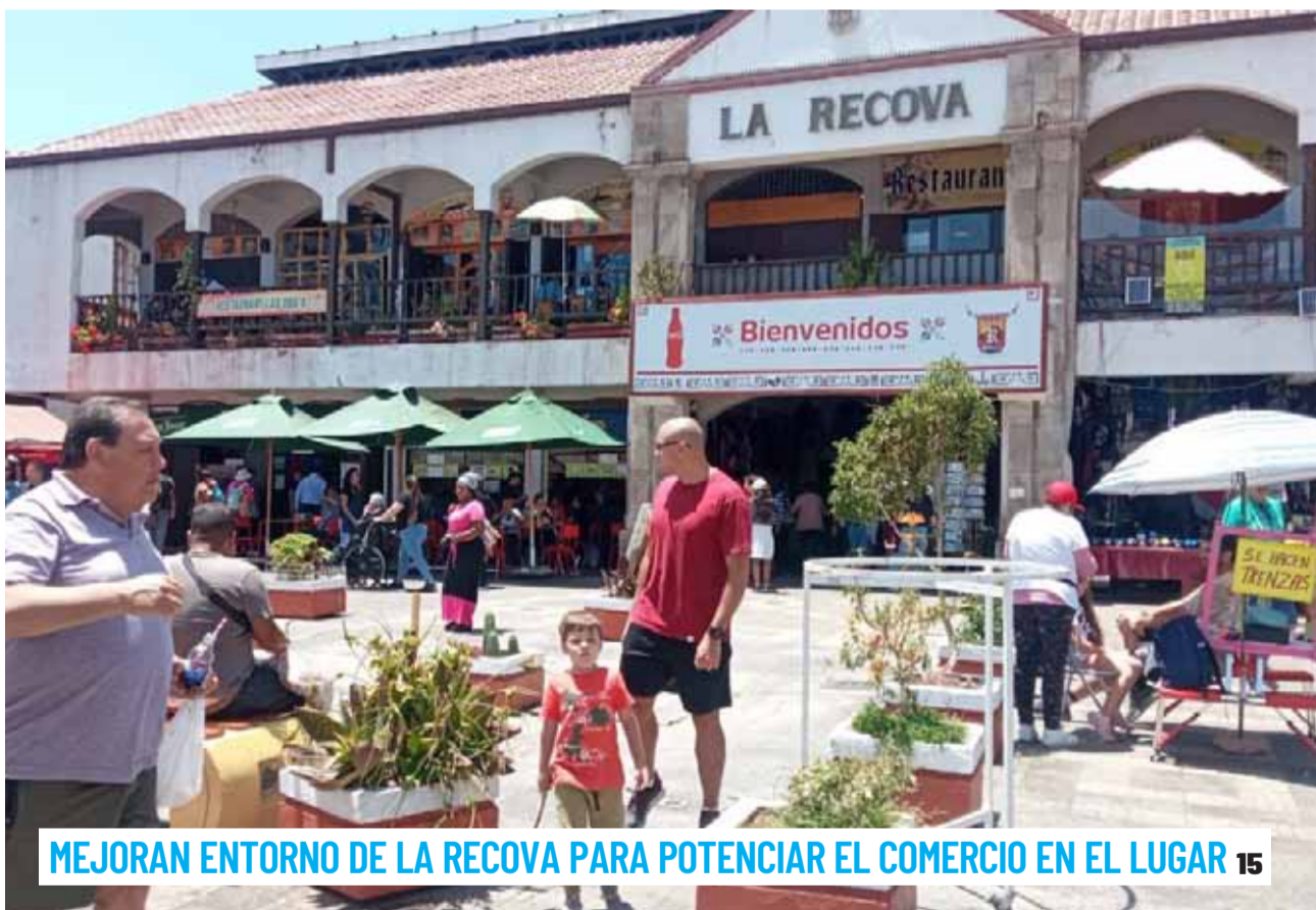
MEJORAN ENTORNO DE LA RECOVA PARA POTENCIAR EL COMERCIO EN EL LUGAR 15