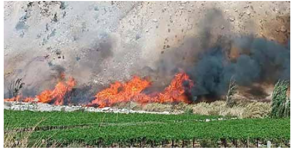
Las altas temperaturas y el fuerte viento reinante ayudaron a la rápida propagación de las llamas en la comuna de Paihuano.

Una de las preocupaciones durante la jornada fue la posible afectación