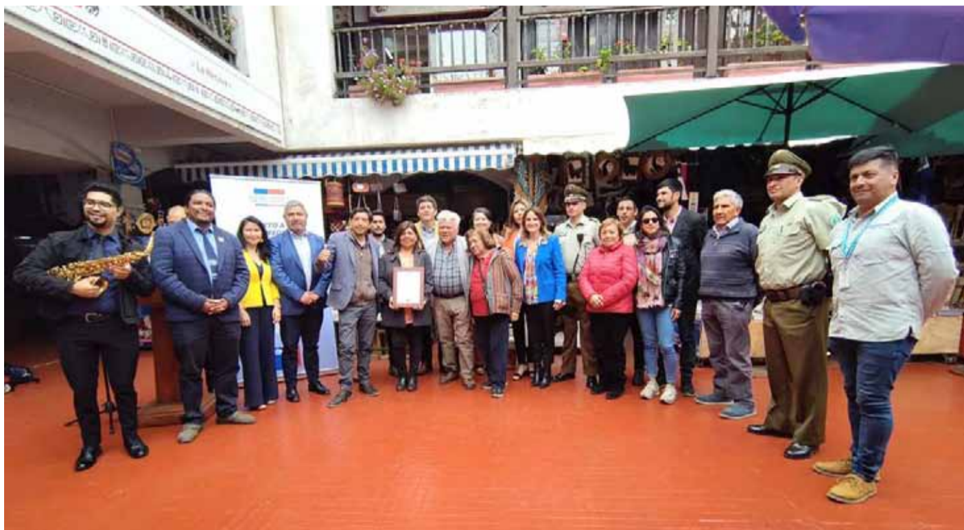
Las mejoras implementadas en La Recova y su sector aledaño corresponden a un programa de trabajo conjunto a tres años.

Durante todo este año 2023, y mediante un trabajo conjunto, los locatarios y locatarias llevaron adelante un plan de trabajo de restauración que consideró la mejora de las fachadas del