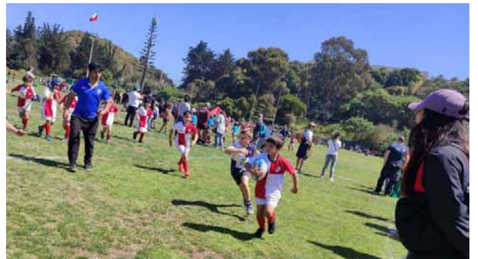
CLUB SAN BARTOLOMÉ

Esta reconocida escuela de la región se dio cita en el festival “Old Navy” efectuado en la ciudad de Viña del Mar y que congregó a otros clubes del país en lo que fue un encuentro formativo y de fraternidad entre quienes practican con la ovalada.