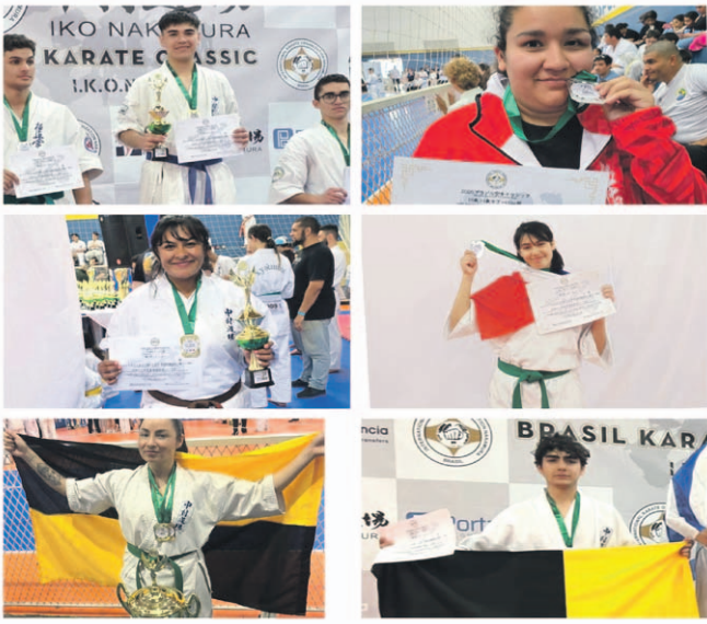
El resultado de Chile fue muy positivo, en especial por el rendimiento logrado por el equipo coquimbano del Dojo Moracam que dejó el corazón en el tatami internacional.