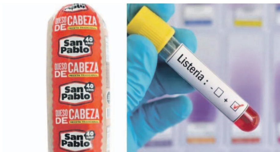
La enfermedad puede causar complicaciones en embarazadas, adultos mayores, bebés y personas inmunocomprometidas.

El Ministerio de Salud extendió la alerta alimentaria por dicha bacteria presente en el queso de cabeza de la empresa San Pablo a otras tres regiones del país, llamando a la población a mantener cuidado con productos de este tipo. Seremi (s) entregó recomendación frente al consumo de alimentos.