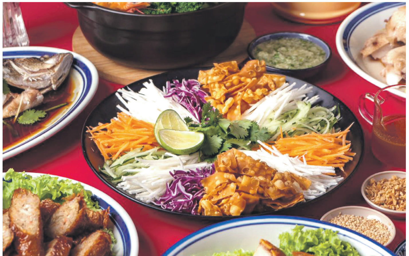
El menú propuesto por la nutricionista es una variedad de opciones que combinan sabor y nutrición.