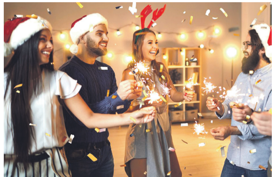
La pregunta inevitable resurge cada año: ¿qué comer para disfrutar sin culpa? Es momento de desatar la creatividad culinaria y alejarse de los tradicionales platillos pesados.