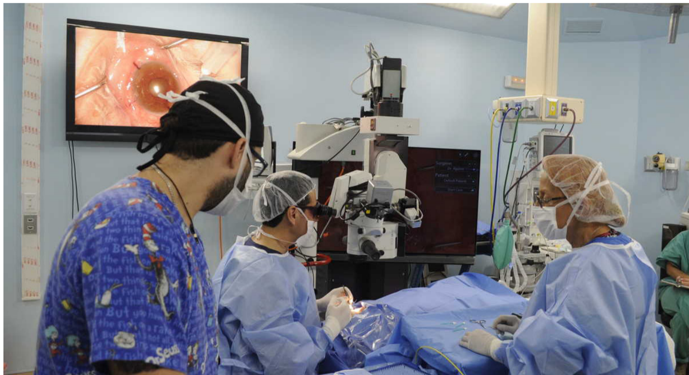
El nuevo hospital de Coquimbo es una de las tres infraestructuras que requerirá de personal especializado.