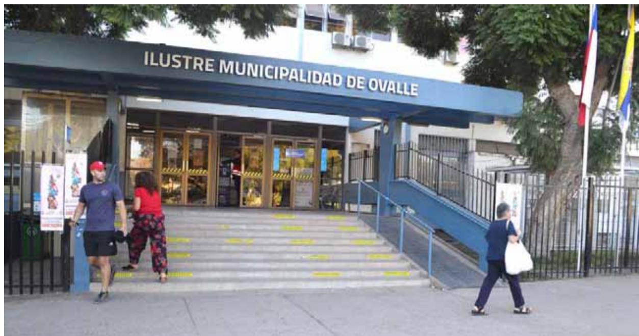
La Municipalidad de Ovalle ha sido cuestionada por el trato directo en la contratación de artistas.

proceso licitatorio antes de llegar a la instancia de trato directo. Lo que la ley establece es que se deben poner los antecedentes ante la unidad fiscalizadora, que es la Contraloría, y hacer un sumario para verificar qué pasó aquí, esto no puede quedar así, no puede seguir sucediendo esto", apuntó.