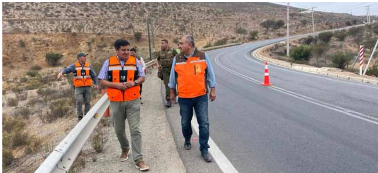
Autoridades de la comuna inspeccionaron la cuesta El Hinojo, lugar en donde frecuentemente se ocasionan accidentes.

Una cámara tecnológica que permitirá leer patentes, determinar la velocidad de los desplazamientos y proporcionar alarmas a los vehículos que poseen encargos policiales, será parte de la implementación de un nuevo proyecto.