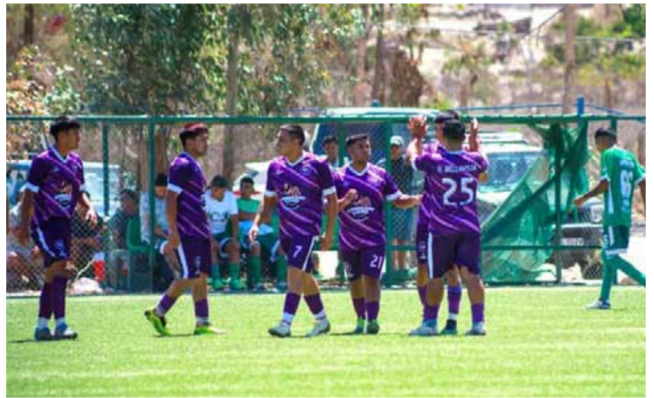
El torneo deportivo congregó a deportistas de las comunas de Vicuña y Paihuano durante el verano.