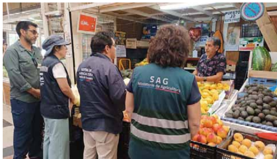
El objetivo de esta actividad en la feria Modelo de Ovalle fue reforzar las actividades del SAG y evitar la propagación de esta plaga, que afecta a una gran variedad de frutas.

Con una actividad de difusión y fiscalización en la feria Modelo de Ovalle, autoridades y el Servicio Agrícola y Ganadero informaron sobre la plaga Ceratitis capitata que afecta a una gran cantidad de frutas. El objetivo es erradicarla en el menor tiempo posible.