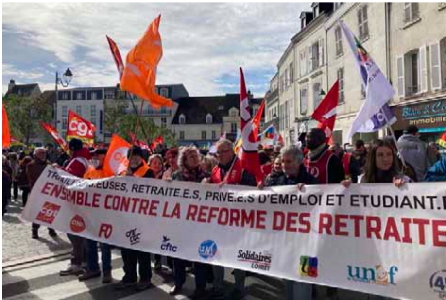
Las protestas no se detienen en Francia.

Este martes tuvo lugar la décima jornada de huelgas y protestas en toda Francia. El gobierno en tanto, rechazó abruptamente la petición de las organizaciones sindicales de poner en “pausa” la reforma de pensiones mientras realizaba una “mediación”.