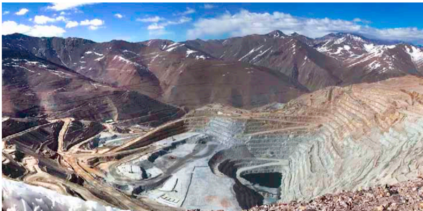
La Región de Atacama es considerada como uno de los territorios con el mayor potencial de crecimiento en relación a la actividad cuprífera.

La operación refuerza la presencia de la empresa canadiense en el país. De esta manera, el nuevo yacimiento, ubicado en la Región de Atacama, duplicará la producción de la firma norteamericana en Chile, la cual ya opera -en la misma zona - la mina de Candelaria.