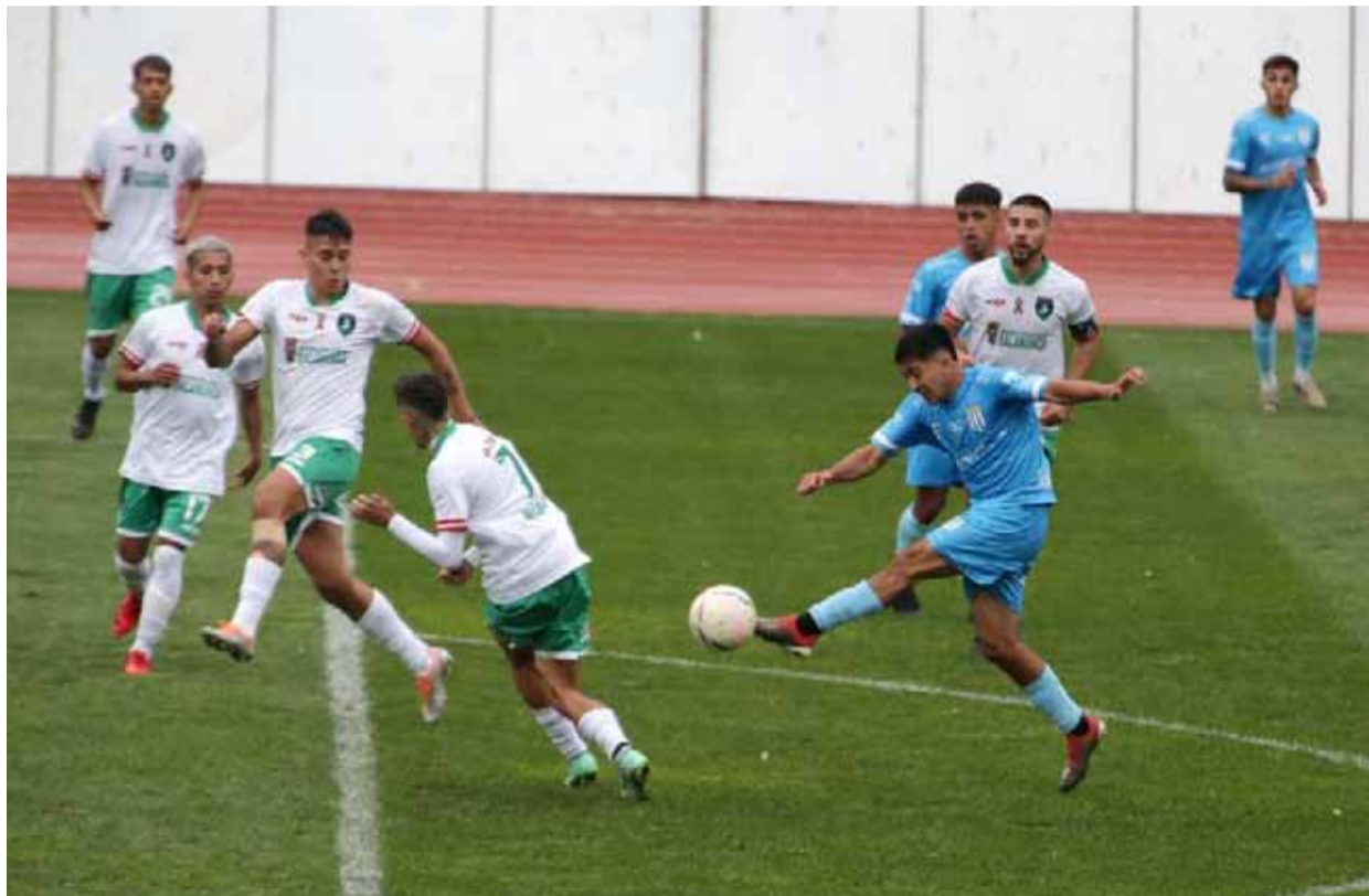
La administración del Estadio La Portada aceptó la petición del DUC de jugar ante La Serena por Copa Chile.

El duelo correspondiente a la primera ronda de la Zona Norte, será el primero que disputarán de manera oficial ambos equipos representativos de la ciudad. Las entradas ya se pusieron a la venta.