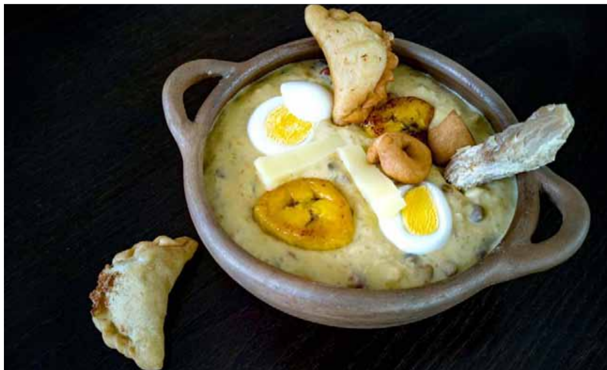
Imagen de la famosa fanesca, el tradicional potaje de la Semana Santa en Ecuador, que se suele servir el Viernes Santo.

Pero junto a las muestras de piedad religiosa o la búsqueda de ocio y descanso, la Semana Santa tiene en la gastronomía uno de sus referentes. Unos días en los que la alimentación adquiere tintes especiales y las mesas se llenan de platos preparados especialmente para la ocasión.