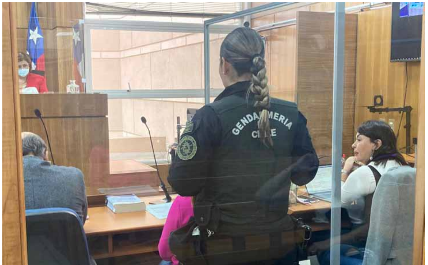
20 y 10 años pide la Fiscalía para los acusados por el delito de homicidio frustrado, y porte de armas en el caso de uno de ellos.

En este contexto, tras la audiencia, la fiscal Carolina Caballero, quien lleva