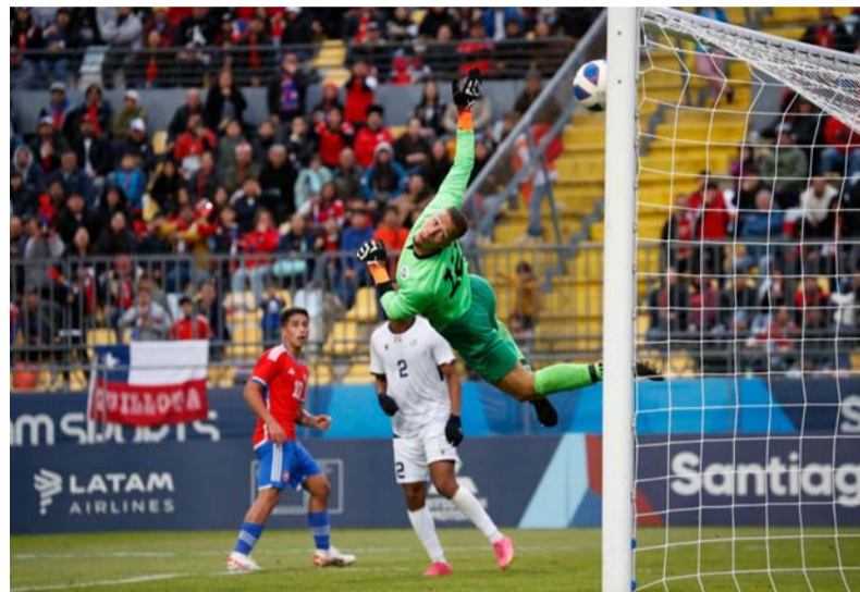
El equipo nacional llega de manera invicta a las semifinales.