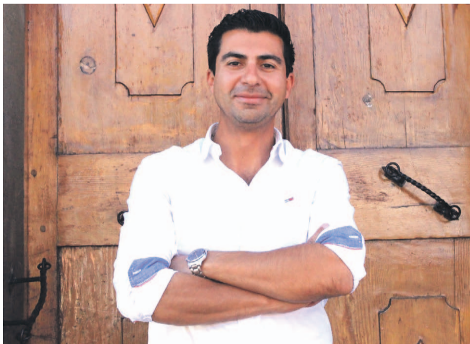
LUCIANO ALDAY VILLALOBOS

El ganador de la última elección municipal en la capital limarina confía en que durante su próxima administración podrá destrabar diferentes proyectos que actualmente son necesarios para el desarrollo de la comuna. No obstante, llamó a trabajar en unidad para lograr esos objetivos.