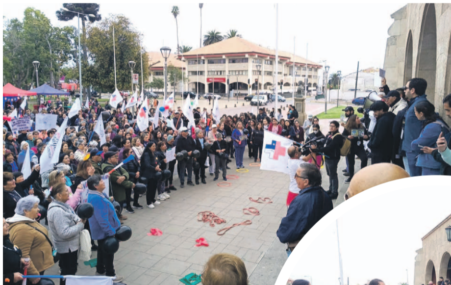
Cientos de adultos mayores se congregaron para manifestarse ante la posible eliminación del programa Más-AMA.

En el marco del paro nacional de la salud que se inició este martes, decenas de personas mayores se manifestaron frente al gobierno regional en La Serena, preocupados por la eventual eliminación del programa Más Adulto Mayor Autovalente. Los beneficiarios denuncian un recorte presupuestario que dejaría sin continuidad una iniciativa clave para su bienestar físico, mental y social.