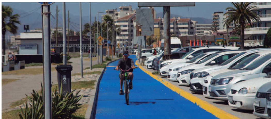
Las ciclovías en Avenida Costanera están listas para recibir a turistas, dando la opción de recorrer parte del borde costero en dos ruedas.

Con respaldo del Concejo Municipal se autorizaron actividades masivas entre las que destaca la muñeca gigante “Rayén Pedalea por Chile”, eventos en vivo y la preparación de los tradicionales balnearios que ya empiezan a recibir a las y los primeros turistas. En la Avenida Costanera se instalarán 3 containers para Carabineros, Seguridad Municipal y la Armada.