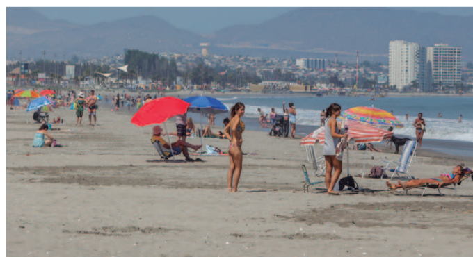
Amplias playas, buen clima y un borde costero seguro con Carabineros, salvavidas y Seguridad Municipal es lo que podrán encontrar las y los turistas que visiten la zona.