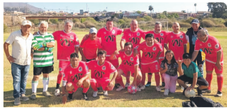
La foto de la serie Sub 50 fue tomada el último fin de semana. CD Los Copihues ahora pretende hacer noticia en la Copa de Campeones de Santa Inés.

Es lo que ha ocurrido en su rico historial de 54 años desde la fecha de su fundación (30 de agosto de 1970), marcando grandes hitos, en especial cuando llegaron a disputar momen-