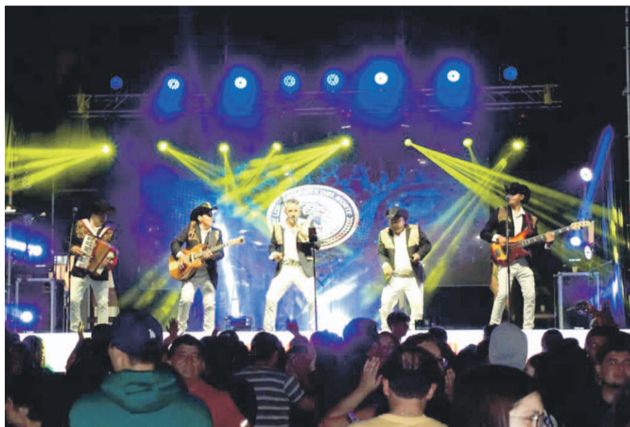
FACEBOOK LOS JAGUARES DEL NORTE

Al igual que el año pasado, ninguna comuna tendrá espectáculos pirotécnicos, lo que se fundamenta por el alto costo y el cuidado de las mascotas y las personas. En cambio, distintas municipalidades apostaron por usar dichos recursos durante Navidad y en actividades que desarrollarán durante todo el verano.