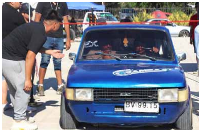
Vehículos “tuneados” de varias partes de Monte Patria se hicieron presentes en la Expo Tuning 2024.