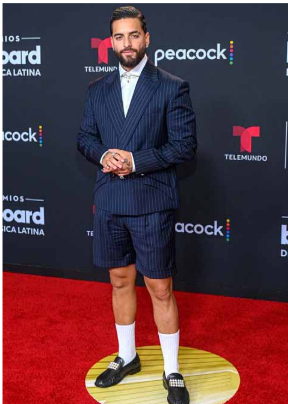
El cantante colombiano Maluma aseguró que "2024 será histórico".

El "Don Juan" colombiano cumple 30 años junto a su novia Susana Gómez, con la que espera una hija, mientras estrena un nuevo lanzamiento con J Balvin y un 2024 lleno de novedades.