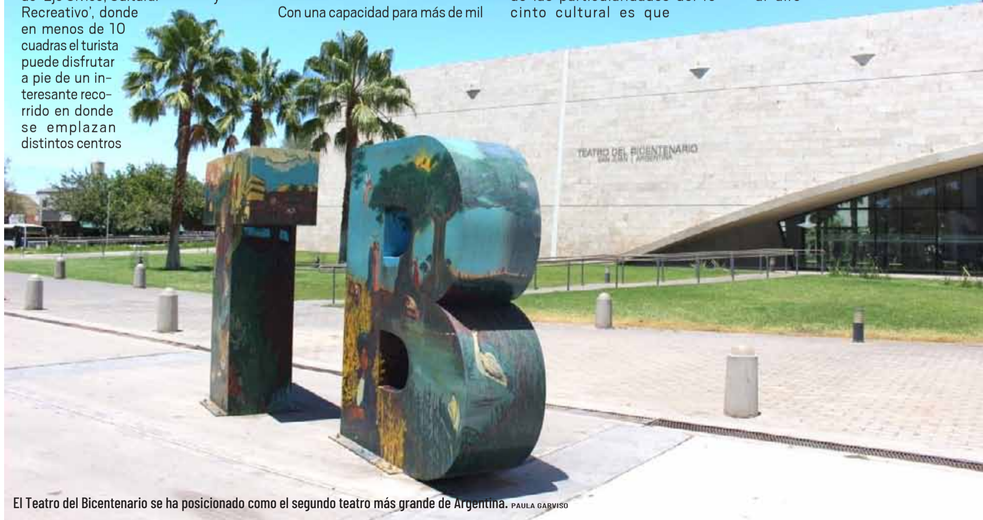
El Teatro del Bicentenario se ha posicionado como el segundo teatro más grande de Argentina. PAULA GARVISO

Al salir, frente al teatro se despliega la Plaza del Bicentenario, un espacio clave de encuentro que abarca más de 23 metros cuadrados, y que integra un espejo de agua, un anfiteatro al aire