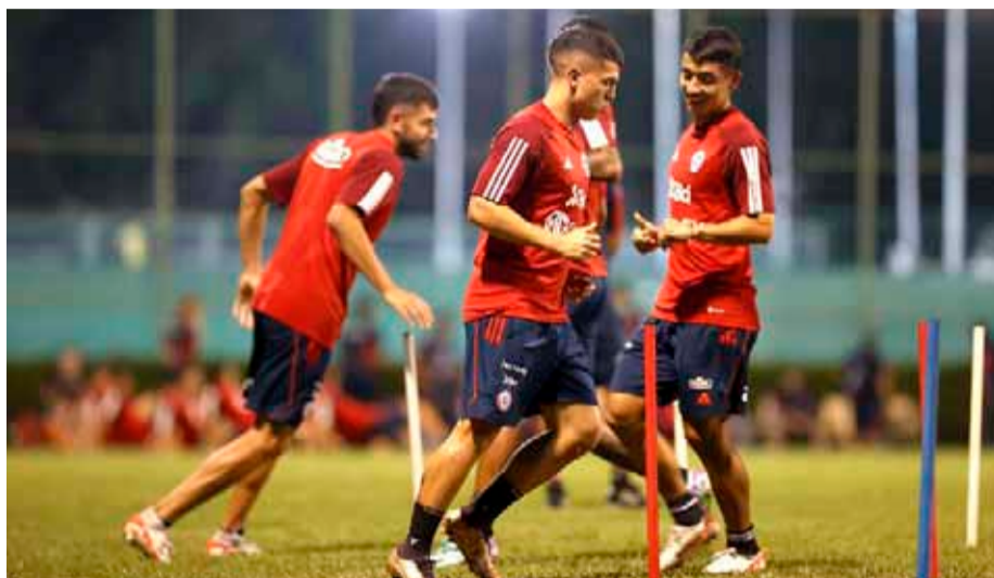
La opciones de Chile para avanzar de fase en el Preolímpico Sub-23 en Venezuela pasan por imponerse ante Argentina este martes.