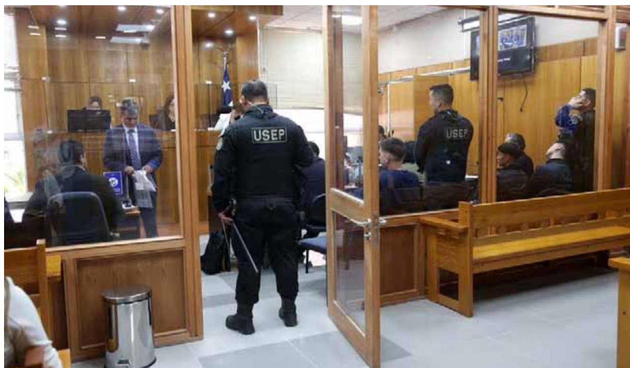
En los alegatos de apertura, la Fiscalía relató como se configuraron los hechos que terminaron con la detención de los cuatro imputados.