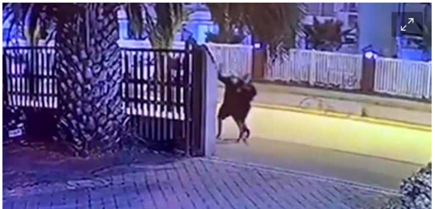
Registro del hecho en julio de 2022, captado por la cámara de seguridad de un apart hotel de Avenida Pacífico.

El hombre relató al Tribunal Oral de La Serena los momentos del ataque y dio cuenta de las severas secuelas que persisten en su hijo producto del disparo en su cabeza. También prestó declaración un perito balístico, una funcionaria de PDI y una médico legista. Para hoy se espera que entregue su versión de los hechos la víctima de 17 años de edad, avanzando en el proceso que podría terminar antes de lo previsto.