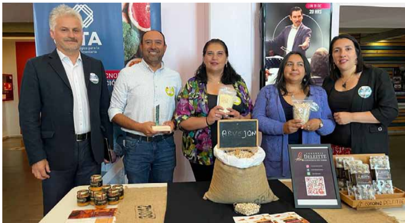
Apojar a los emprendedores locales, especialmente a mujeres, fue uno de los focos de trabajo de Corfo en 2022.

Lo anterior se tradujo en más de $2.400 millones de pesos dispuestos a través de recursos del Fondo Nacional de Desarrollo Regional (FNDR) y más de $1.500 millones mediante el Fondo de Innovación para la Competitividad Regional (FIC-R), llegando a un total de casi