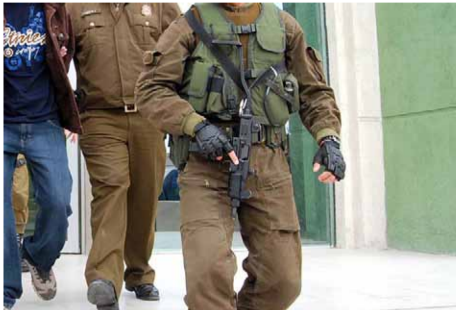
El proyecto de ley busca entregar más atribuciones a las policías y aumentar las penas para quienes atenten contra ellos.