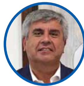
Rafael Vera ALCALDE DE VICUÑA

“Siempre es bueno buscar el consenso en pos del desarrollo y que la ejecución presupuestaria efectivamente se realice”