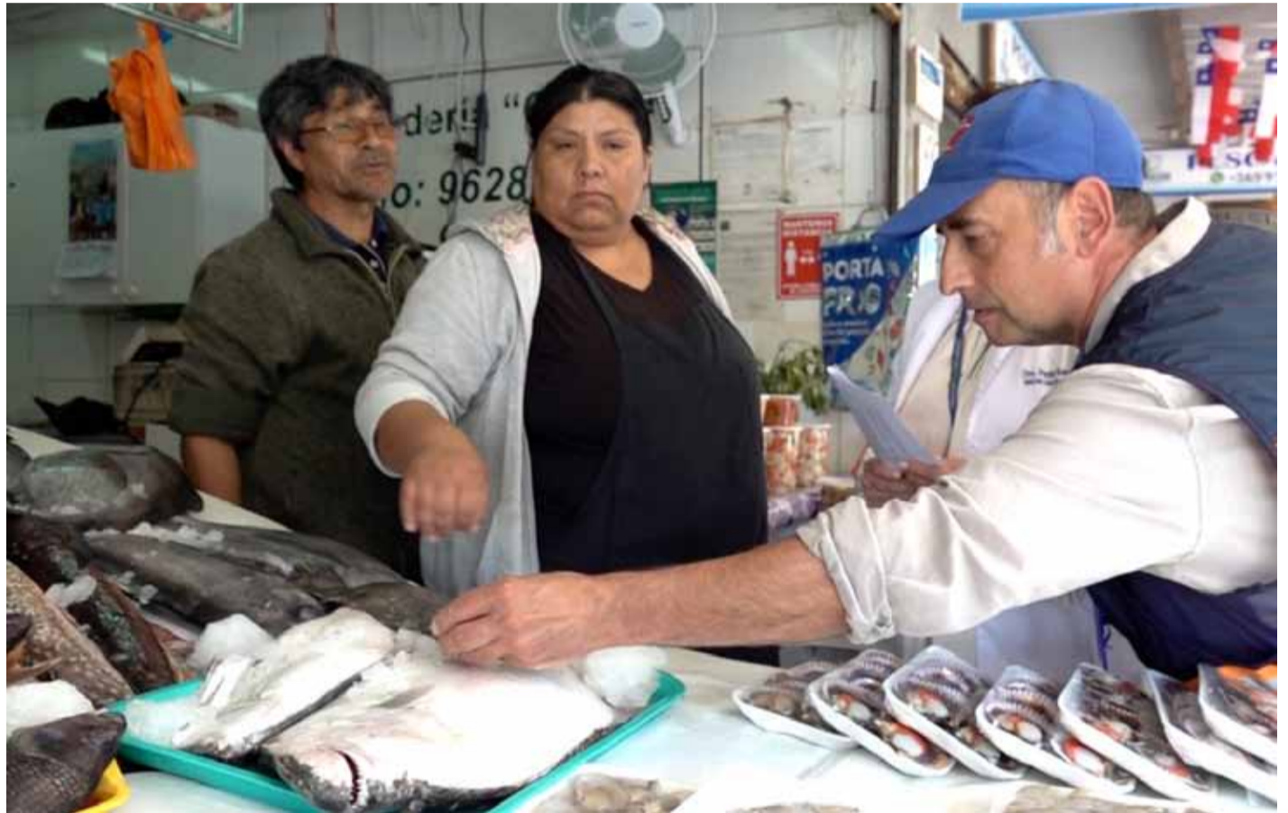
Las autoridades de Salud hicieron un llamado a mantener las medidas de higiene a la hora de manipular alimentos del mar.

También, el profesional explicó que es muy importante que el local donde se compre el pescado cuente con todas las condiciones sanitarias. Por ello afirmó que el pescado sólo debe ser comprado y consumido “en