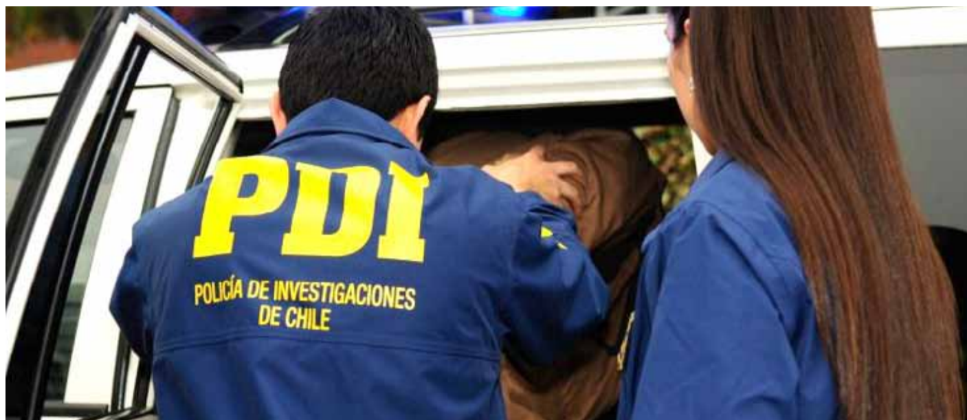
La imputada quedó detenida tras asistir a la PDI a declarar en una investigación de homicidio.

El Juzgado de Garantía de Ovalle decretó el traslado a Huachalalume de una mujer imputada por el delito de homicidio frustrado, tras declarar en la investigación que lleva adelante la PDI, por el asesinato de su hermano, ocurrido el jueves pasado, en el sector de la Villa Agrícola de la capital limarina.