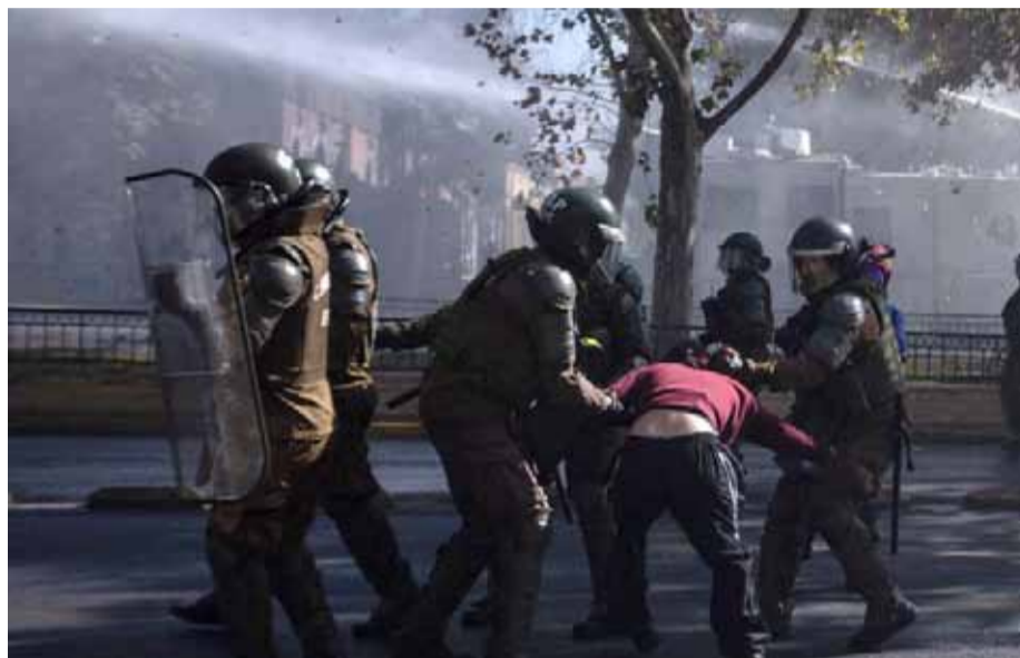
Carabineros detienen a un estudiante durante una manifestación realizada en la mañana de este 29 de marzo.

Un uniformado herido a bala, pero fuera de riesgo vital, enfrentamientos de encapuchados con Carabineros y buses incendiados, marcaron gran parte de la conmemoración del día del joven combatiente en la capital.