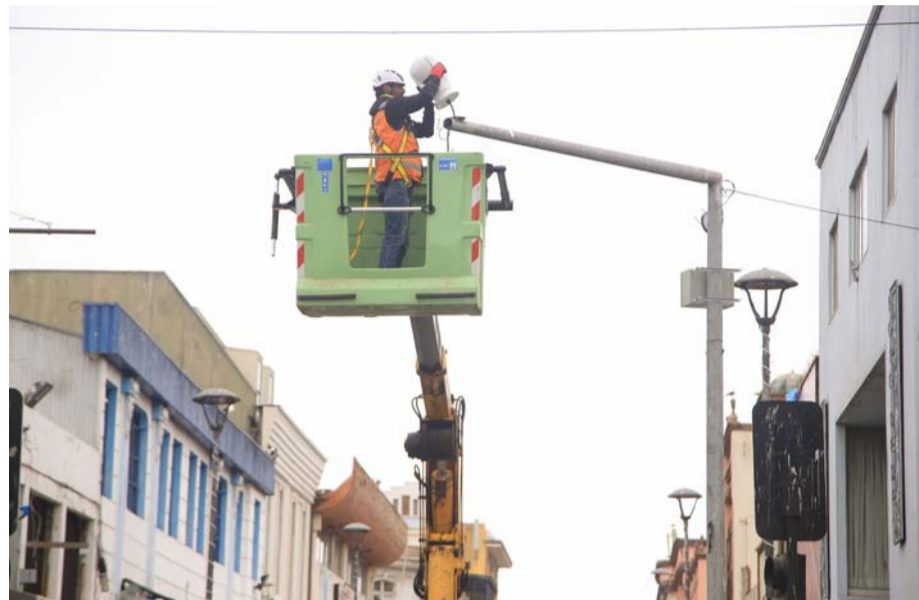
Los dispositivos pueden mejorar las capturas en espacios con distinta luminosidad y poseen zoom óptico.

Contar con una zona céntrica revitalizada y más segura es el objetivo del Municipio de Coquimbo, es por ello que avanza la adquisición e instalación de 21 nuevos puntos de cámaras de televigilancia para esta área. La iniciativa es parte del plan Estratégico de Revitalización del Centro que lidera el alcalde Ali Manouchehri, que incluye la ejecución de 18 proyectos que suman cerca de 5 mil millones de pesos para dar una nueva vida a