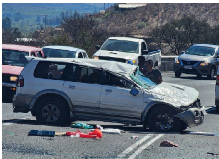
El fatal accidente en la Ruta D-55 se registró a las 18:40 hrs el pasado jueves 28 de marzo.