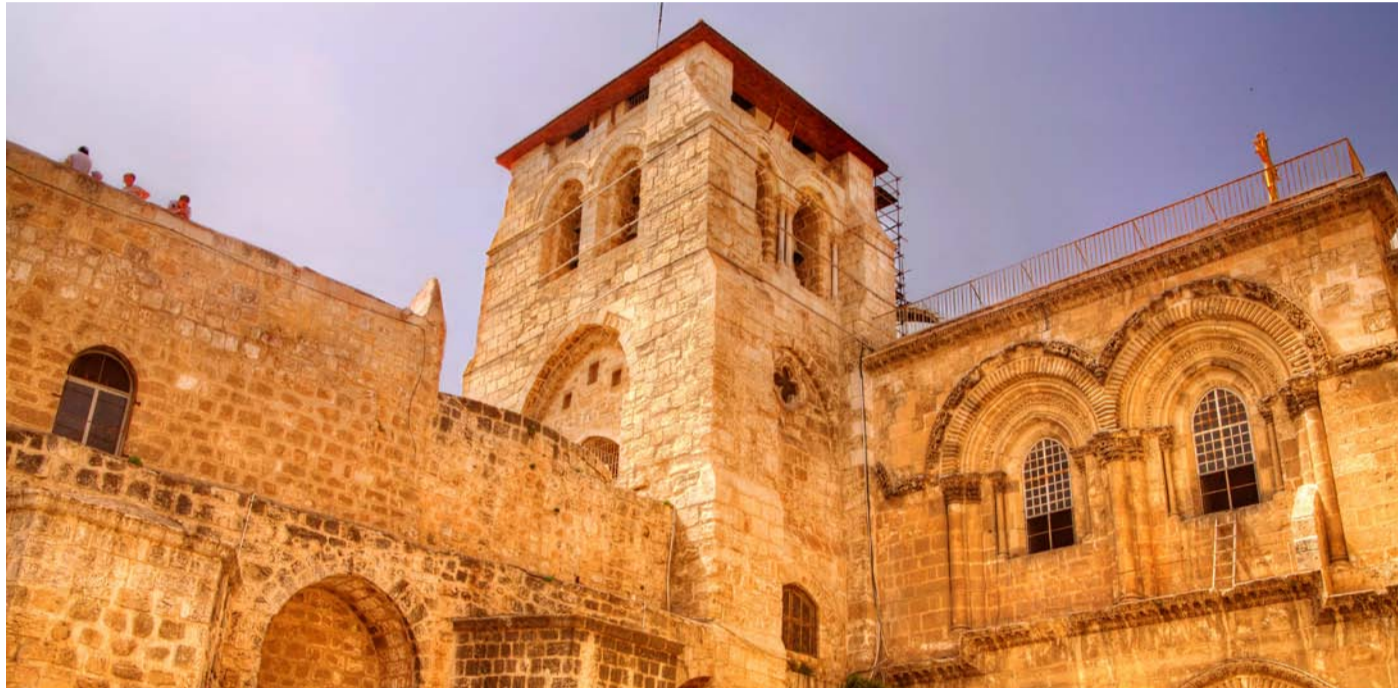
Iglesia del Santo Sepulcro (Jerusalén, Israel).