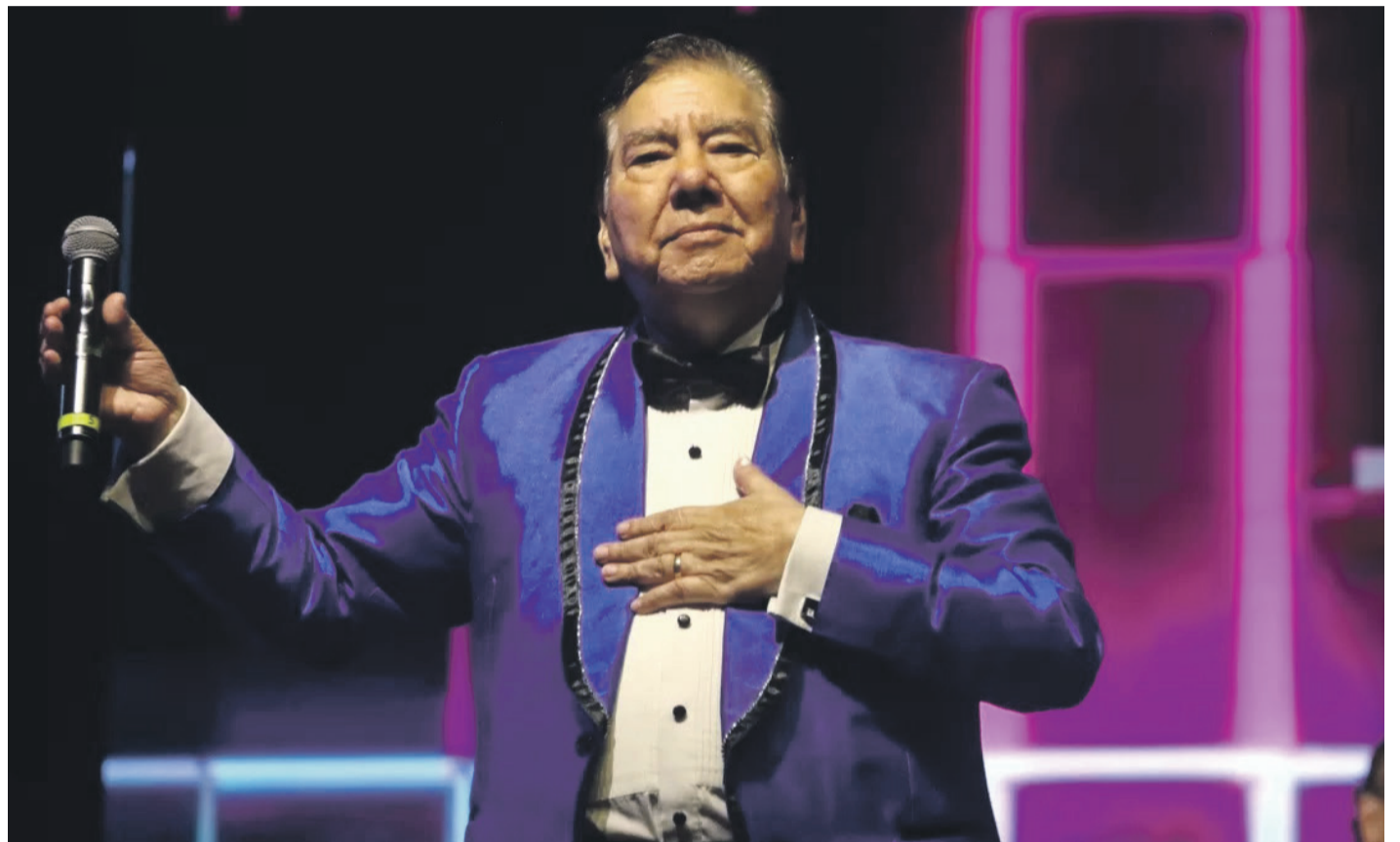
Los músicos indican que el comportamiento de Tommy Rey dentro y fuera del escenario es un ejemplo a seguir para los jóvenes de hoy.

Repasó parte de la trayectoria y recordó que para los 45 años de los Vikings 5, Tommy Rey les acompañó en el escenario y en la celebración, “Nosotros estuvimos con él en muchas presentaciones a lo largo de Chile durante muchos años. Siempre conversábamos en los camarines, compartíamos antes de subir al escenario. En los últimos años ya notábamos que él estaba un poquito más cansado, un poquito más tranquilo, pero en el escenario era todo un artista, podría haber seguido cantando unos 10 años más. Tenía una voz intacta, una voz maravillosa. Los boleros de Don Tomm eran maravillosos”, apuntó.