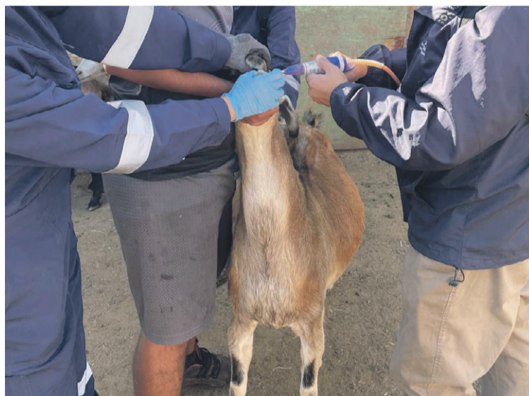
Los ganaderos de la provincia de Elqui acceden a este beneficio, mejorando la salud de sus animales y, con ello, su producción.