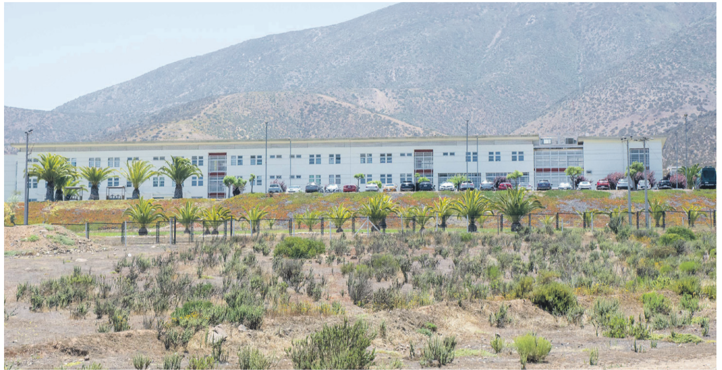
Alertas por presencia de roedores en el Complejo penitenciario Huachalalume activa protocolos de control sanitario.

"Desde hace 2 años que estamos dando a conocer nuestros requerimientos, sin tener respuesta positiva de las autoridades políticas ni del servicio, también hemos hablado con parlamentarios de todos los colores