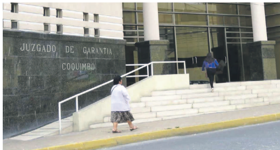
El juez estableció un plazo investigativo de 90 días para esclarecer este grave hecho. EL DÍA

En prisión preventiva quedó el autor del hecho, el que además, fue imputado por el delito de robo calificado con retención de persona.