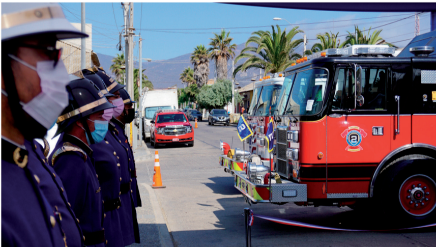
El primer arribo se concretó en la comuna de Los Vilos, con la llegada de un Pierce Lance para la bomba de Pichidangui. La máquina es hoy uno de los carros más completos de la Región de Coquimbo y, gracias a otros aportes como la entrega de equipos de telecomunicaciones o piscinas de almacenamiento, han dado un salto de calidad para la institución.