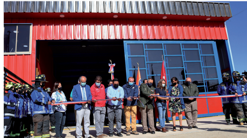
En esta misma línea, pero a través del Fondo de Desarrollo Comunitario que la compañía impulsa en la localidad de Caimanes, se materializó uno de los principales anhelos de la comunidad, que era contar con un cuartel de bomberos para los 16 voluntarios de la Cuarta Compañía. La construcción de 520 m2 considera estacionamientos, salón de reuniones, bodegas, oficinas, cocina, dormitorios y otros espacios que favorecen el oficio y desarrollo de la institución.