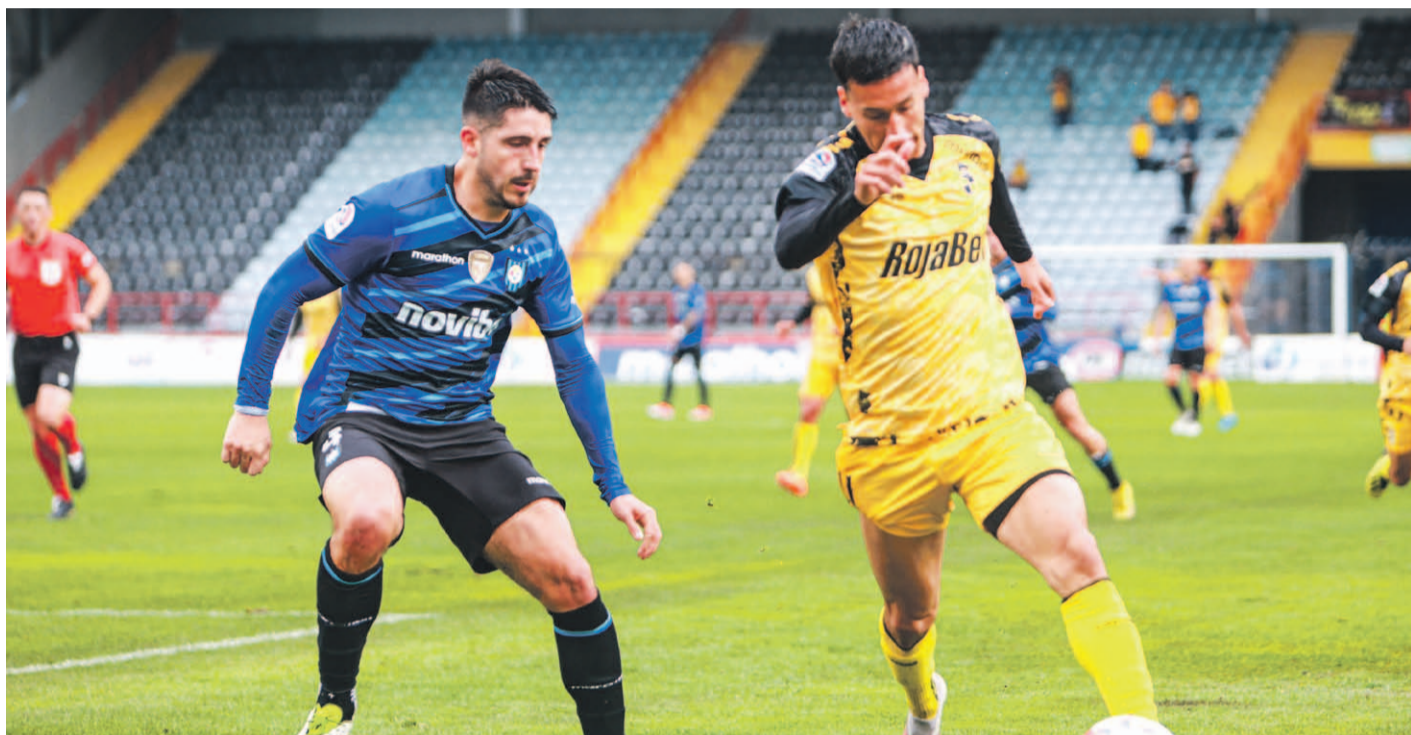
Coquimbo Unido enfrentó a Huachipato en partido válido por la fecha 26 de la Primera División.

El elenco "pirata" cayó por 3 a 2 en su visita al sur del país, resultado que por el momento lo mantiene en un octavo lugar que lo clasificaría a Copa Sudamericana, pero sus más cercanos perseguidores acortan diferencia en la tabla de posiciones y amenazan con arrebatarse ese cupo.