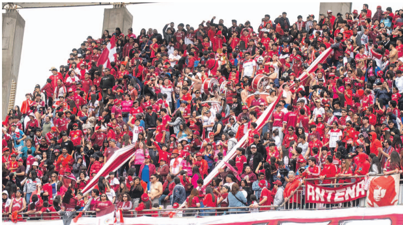
12 mil hinchas granates celebraron el ascenso de Club Deportes La Serena la tarde del domingo en La Portada.