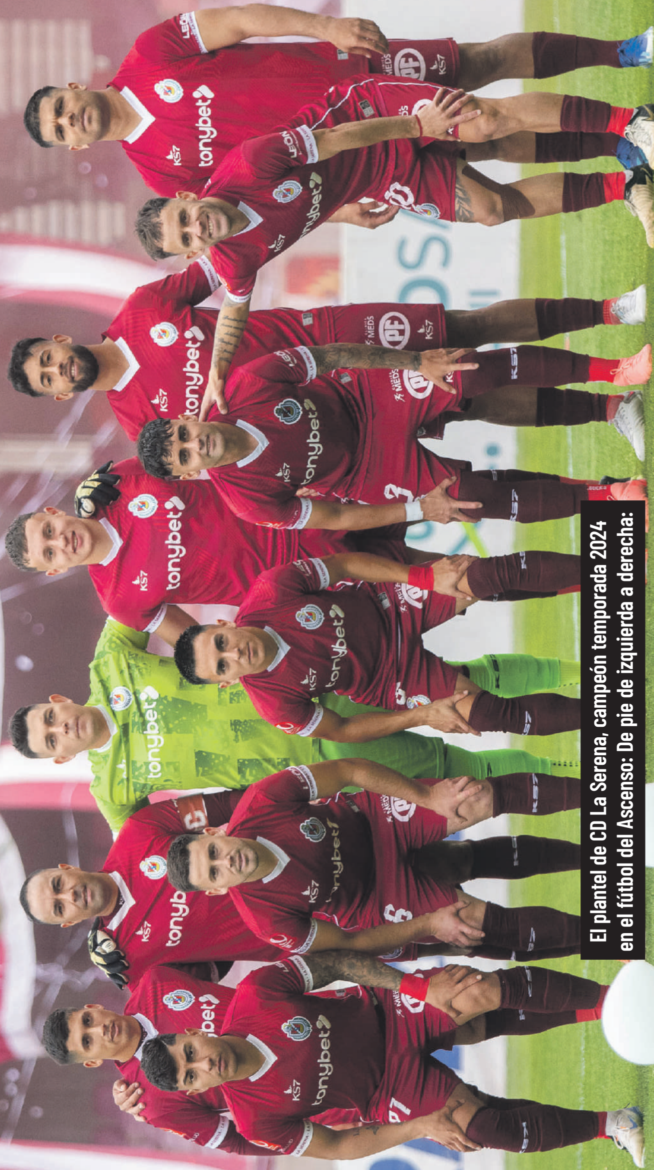
El plantel de CD La Serena, campeón temporada 2024 en el fútbol del Ascenso: De pie de izquierda a derecha: