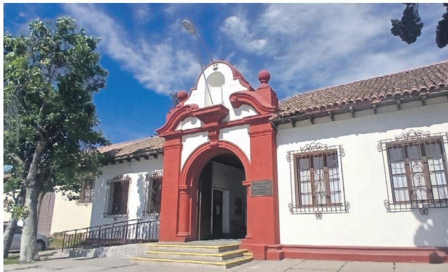
Los distintos cementerios de la región funcionarán con horarios extendidos y con coordinaciones en materia de seguridad.

Los días 30 y 31 de octubre y 1 y 2 de noviembre, los distintos camposantos de la zona se encontrarán disponibles con jornadas más largas para que deudos se reencuentren con sus familiares. Según informaron distintos municipios, habrán servicios anexos para los visitantes durante los días feriados.