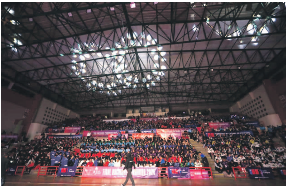
El evento culminó con una vibrante ceremonia de premiación en el Coliseo de La Serena, que se llenó de colores y la energía de todas las delegaciones.

“Ha sido una jornada espectacular y una semana de juegos impresionantes. Estamos muy contentos como región por el nivel de la organización,” señaló