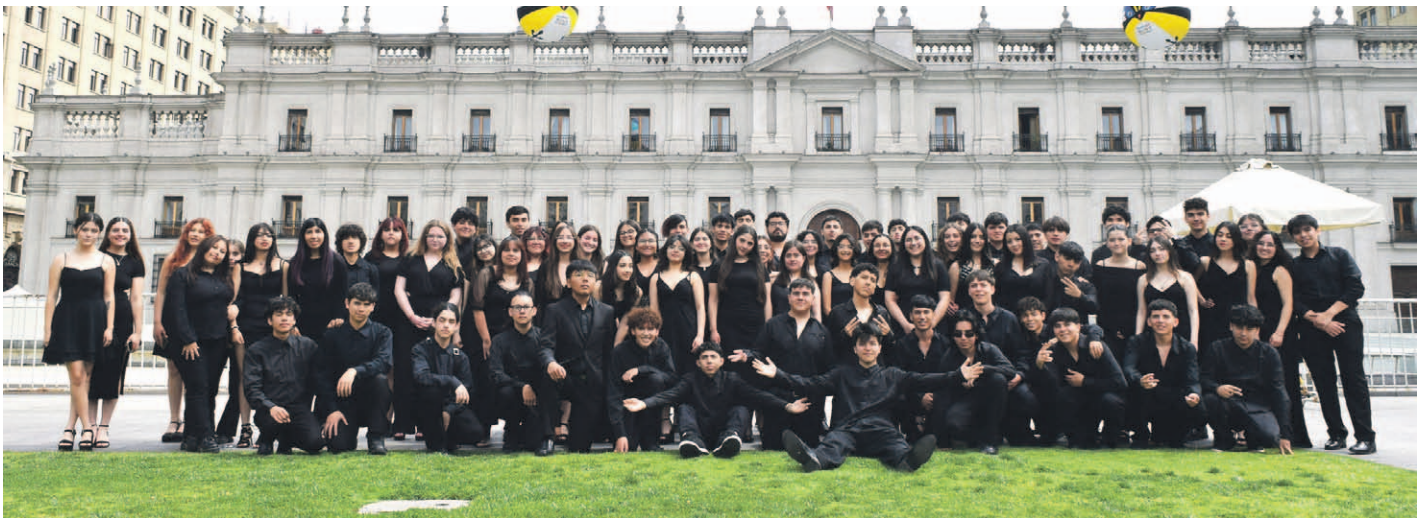
La imagen corresponde a la Orquesta Sinfónica Juvenil Jorge Peña Hen que se presentó el año pasado en el Centro Cultural La Moneda.

Con el respaldo del Gobierno Regional de Coquimbo y la Fundación Sinfónica Elqui, la histórica agrupación de la Escuela Experimental de Música de La Serena presentará un programa que combina clásicos universales y piezas latinoamericanas, reafirmando su legado y el talento de los jóvenes músicos de la región.