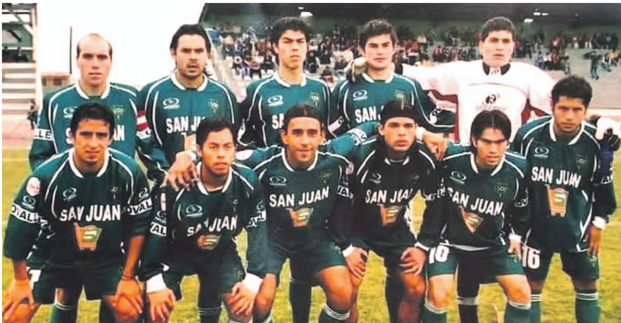
Este jueves se conmemoran dos décadas de la última participación del CDO en Primera B tras perder la categoría en 2005.

Este jueves se conmemoran dos décadas de la última participación del CDO en Primera B tras perder la categoría en 2005. Resta de puntos, problemas dirigenciales y una sorprendente campaña que no alcanzó, marcaron uno de los recuerdos más amargos para los “Verdes del Limarí”.