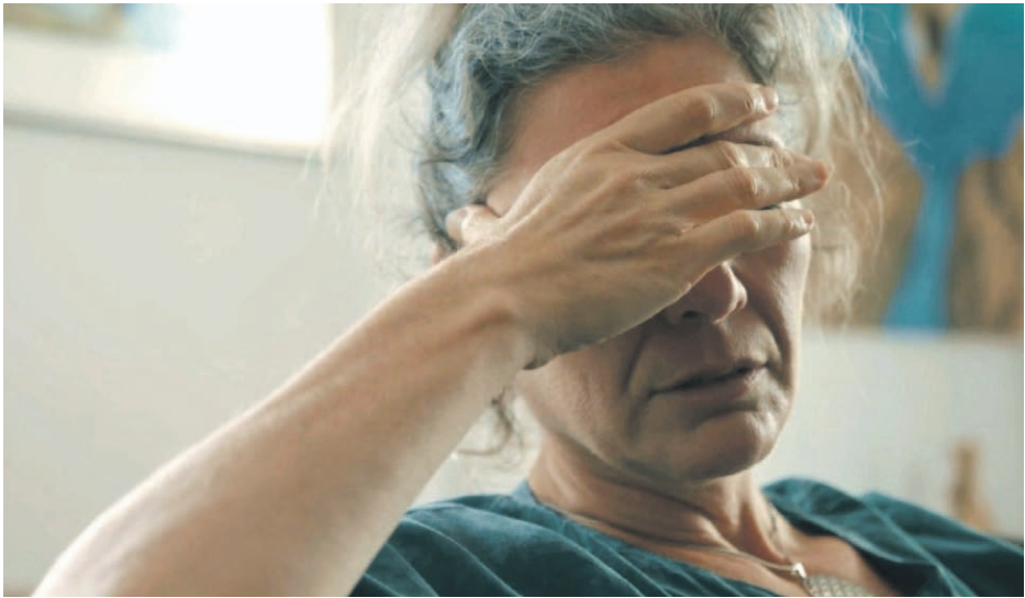
Durante un Ataque cerebral, hasta dos millones de neuronas se pierden por minuto, por lo que cada segunda cuenta.