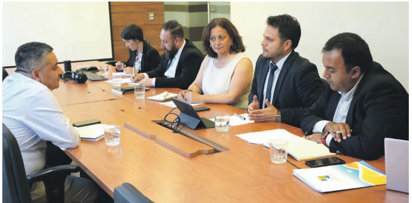
Las autoridades regionales, junto con sus equipos técnicos, se desplazaron a las oficinas del Ministerio del Interior, la Subsecretaría de Desarrollo Regional (SUBDERE) y la DIPRES para agilizar la ejecución de proyectos priorizados por el GORE.

Desde el gobierno regional aseguran que el organismo dependiente del Ministerio de Hacienda no estaría efectuando el pago de facturas a empresas contratistas relacionadas con obras de infraestructura ni cumpliendo con las transferencias comprometidas, como las correspondientes al Programa de Empleabilidad con los municipios.