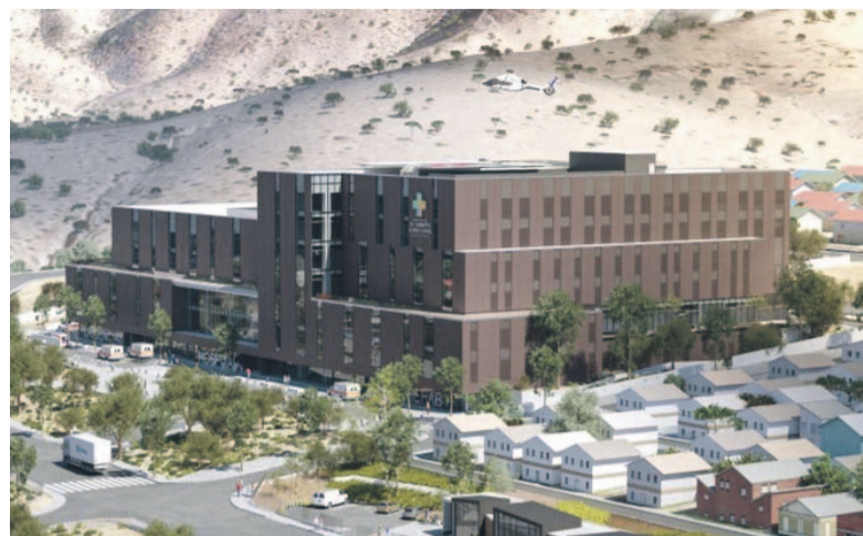
El futuro hospital de Illapel tendrá un total de 135 camas de hospitalización y 6 pabellones de cirugía mayor.