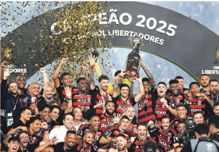
Flamengo se tomó revancha de Palmeiras, que lo había derrotado en la final de 2021 en Montevideo. Con esta victoria suma su cuarta Copa Libertadores.