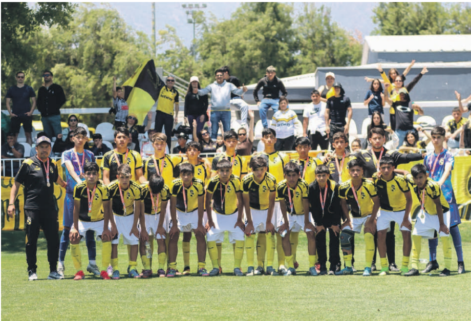
El elenco sub 14 disputó la final ante Colo Colo durante la mañana, inclinándose ante el conjunto capitalino.

Coquimbo Unido volvió a escribir una página dorada en su extraordinario 2025. Esta vez, el turno fue de la sub 13, equipo que alzó el título nacional en el CAR José Sulantay Silva de Peñalolén, tras imponerse por la cuenta mínima a Universidad Católica en una final tensa, estratégica y de alto nivel competitivo. El cuadro dirigido por el histórico formador Benjamín Valenzuela sostuvo desde el primer minuto un plan de juego valiente, sostenido en la pre-