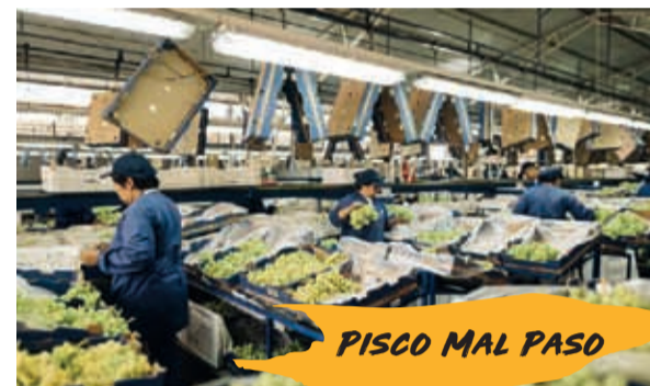
PISCO MAL PASO

El recorrido también puede incluir la visita a la planta de Azur, espumante orgánico de exportación producido con métodos artesanales, aprovechando el gran potencial de la zona para los vinos blancos Chardonnay y Sauvignon Blanc y el tinto Pinot Noir, base del champaña.