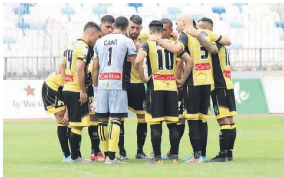
Los jugadores están juramentados en mejorar el rendimiento mostrado en Antofagasta.

El día martes tras el partido entre Colo Colo y Palestino en el estadio Monumental un carro de carabineros