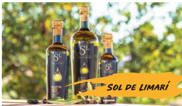
SOL DE LIMARÍ

Gracias a la cercanía con Viña Tabalí, es posible incluir dentro del recorrido el Monumento Histórico Arqueológico Valle del Encanto, caracterizado por la presencia de piedras tacitas y vestigios de los pueblos pre-hispánicos Molle y Diaguita.