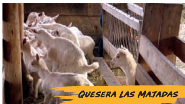
QUESERA LAS MAJADAS

Cuenta con la particularidad de estar ubicada en un sector de clima muy seco, escasas precipitaciones y gran cantidad de días despejados, como es la comuna de Punitaqui.