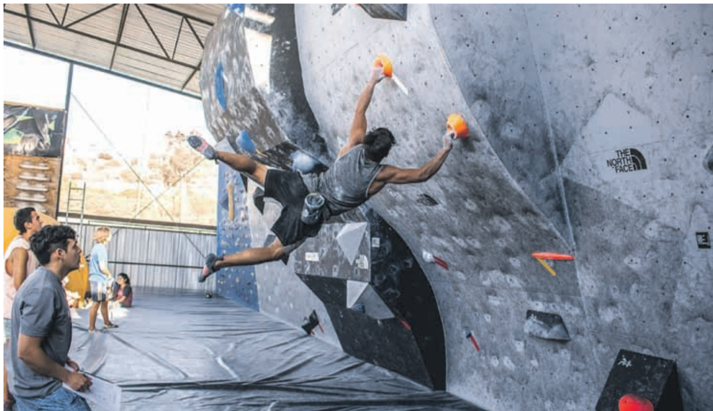
En La Serena se practica el boulderside a un costado de las canchas del Club Pingüino.