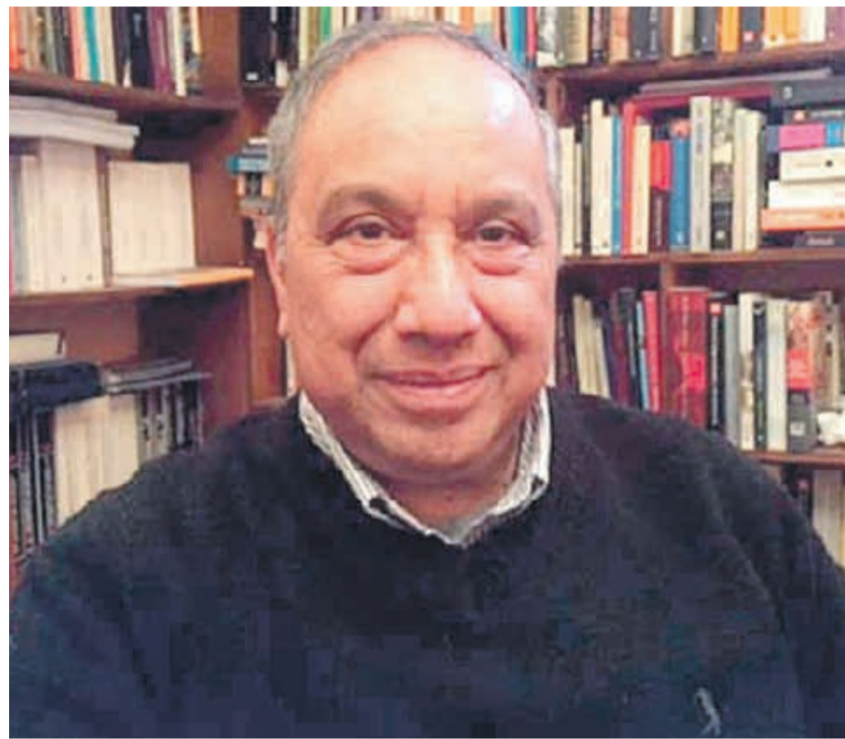
El escritor José Leandro Urbina estará este viernes en un conversatorio en La Serena.

Sus cuentos de Las Malas Juntas, publicados por la Editorial Planeta y LOM ediciones en Chile, y Akal en España, han sido traducidos a diversos idiomas. En su reedición del año 2010 contó con