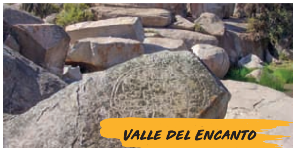
VALLE DEL ENCANTO

Gracias a la cercanía con Viña Tabalí, es posible incluir dentro del recorrido el Monumento Histórico Arqueológico Valle del Encanto, caracterizado por la presencia de piedras tacitas y vestigios de los pueblos pre-hispánicos Molle y Diaguita.