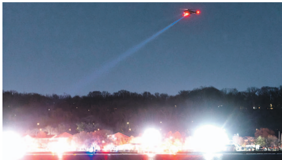
Los equipos de rescate buscan en el río Potomac los restos del avión accidentado.

El presidente de Estados Unidos responsabilizó al piloto del helicóptero Black Hawk y a las políticas de contratación bajo diversidad en el control aéreo. Se confirmó además, la muerte de un padre argentino y su hijo chileno.