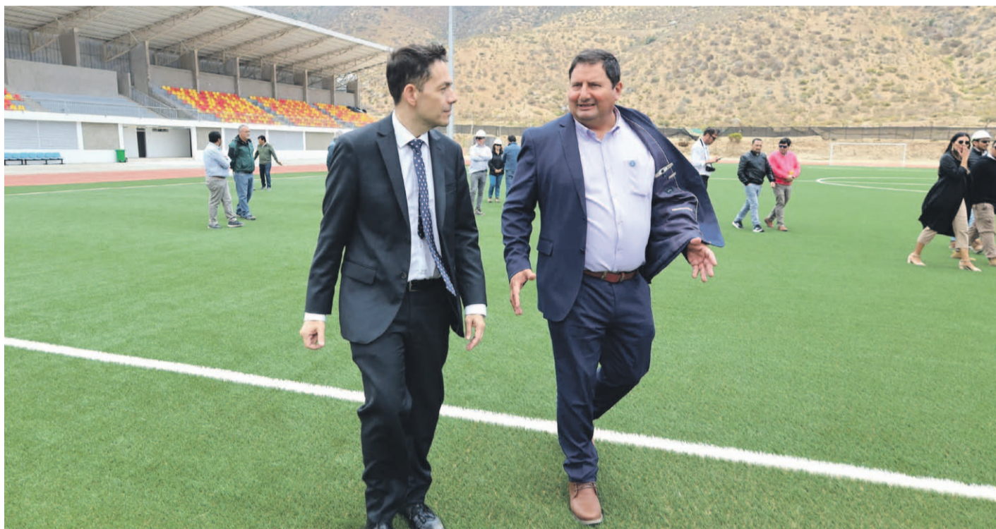
El gobernador Cristóbal Juliá estuvo en terreno para observar el avance de las obras del estadio de Canela, las que deberían terminar en abril próximo, según la extensión de plazo solicitada por la empresa.

“El gobierno regional y el Consejo Regional comprenden que esta obra es crucial para mejorar la calidad de vida de los habitantes de la comuna