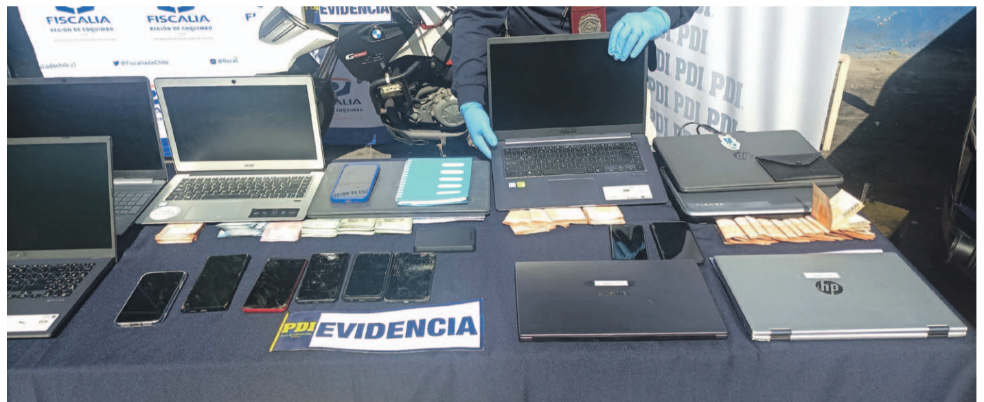
Durante el procedimiento policial se detuvieron a 13 personas en tres regiones distintas del país.

En tal sentido, aclaró que, respecto a las personas que fueron detenidas, no todas efectuaban labores dentro de la corporación. "De los 22 sujetos, la mayoría son externos que no eran parte de la corporación, sino que, justamente los terceros reclutaban a estas personas que prestaban sus cuentas. Incluso dentro de este es-