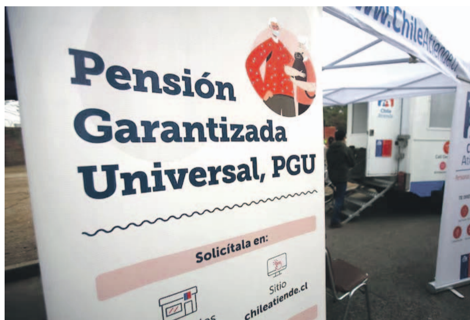
La PGU aumentará de forma gradual hasta alcanzar los 250 mil pesos.

La implementación de la normativa será gradual y a seis meses de publicada se verán los primeros beneficios de la propuesta con el aumento de la PGU.