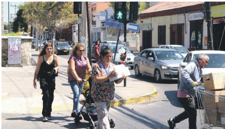
La intersección de la calle Juan de Dios Peni con Balmaceda, es reconocida como un cruce peligroso.