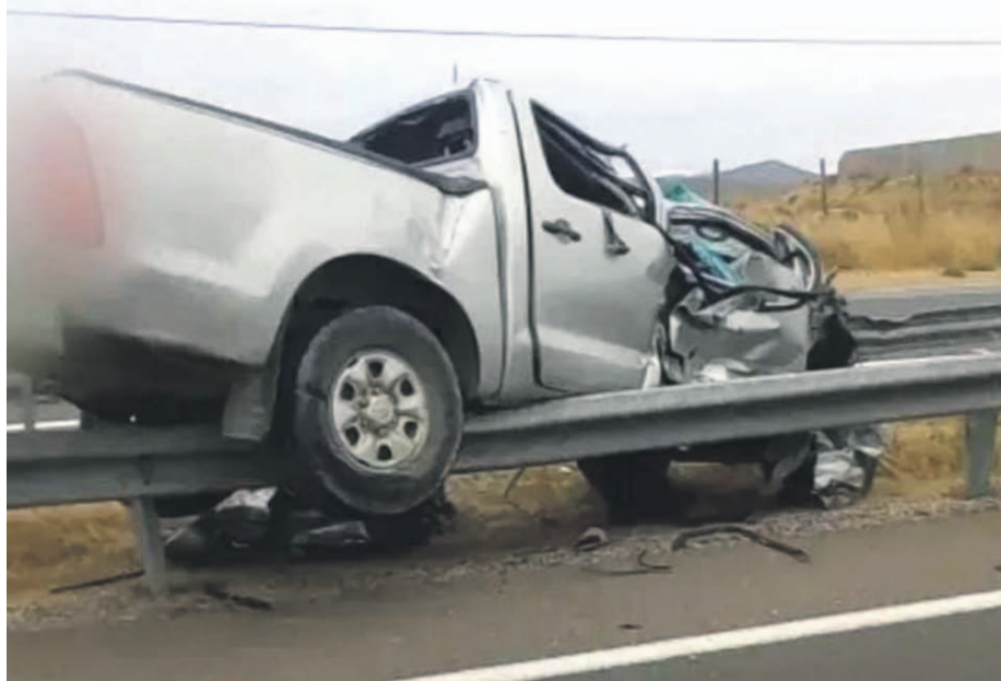
El fatal accidente se produjo a las 08:00 horas de este jueves.

En momentos en que el vehículo se trasladaba por la calzada oriente de la carretera, el conductor perdió el control del móvil, chocando contra la barrera de contención y volcando en el lugar. Las causas del siniestro están siendo investigadas por la SIAT de Carabineros.