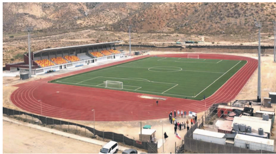
Destacó la autoridad regional que esta obra es crucial para mejorar la calidad de vida de los habitantes de la comuna de Canela.

Durante la visita de las autoridades, se explicó que actualmente existe una nueva solicitud de plazo de aproximadamente 90 días para terminar con el 10% restante de la obra que queda