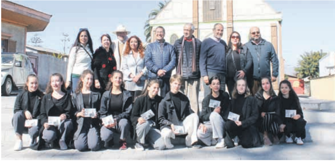
Autoridades, bailarines y representantes de Alianza Francesa ICF Región de Coquimbo y Galería Chile Arte.