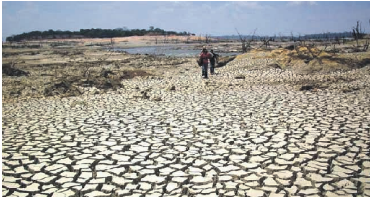
Una serie de problemas se vienen generando en el sector agrícola de la región por la falta de agua en la zona