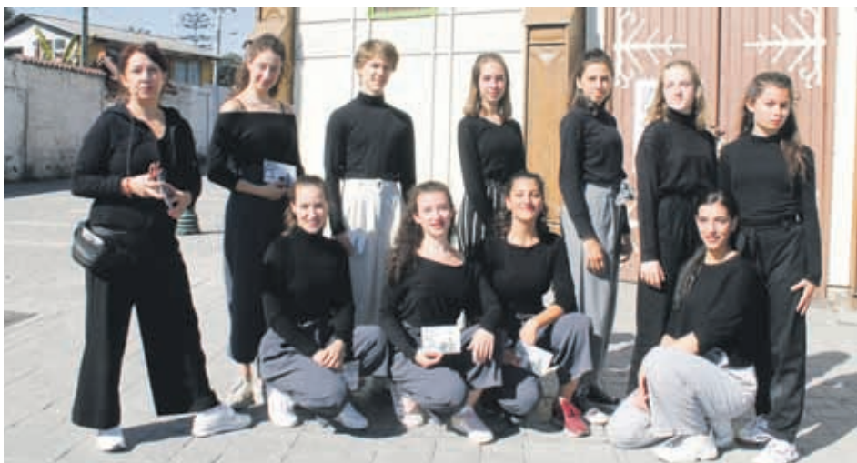
Integrantes de Izumi junto a su directora.