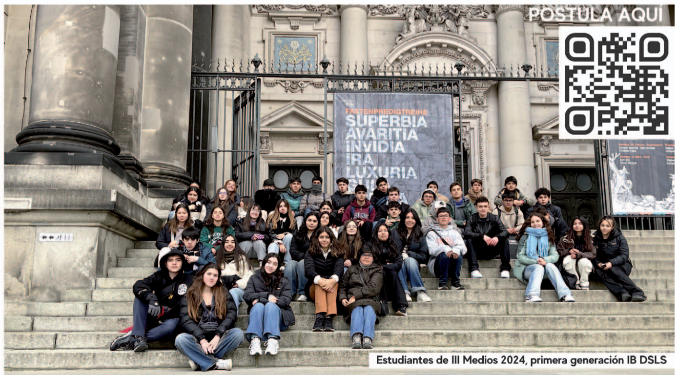
Estudiantes de III Medios 2024, primera generación IB DSLS

De igual forma, seguirá trabajando por la promoción de la lengua, tradiciones y cultura alemana, con el objetivo de desarrollar, aún más, el perfil internacional entre sus alumnos.