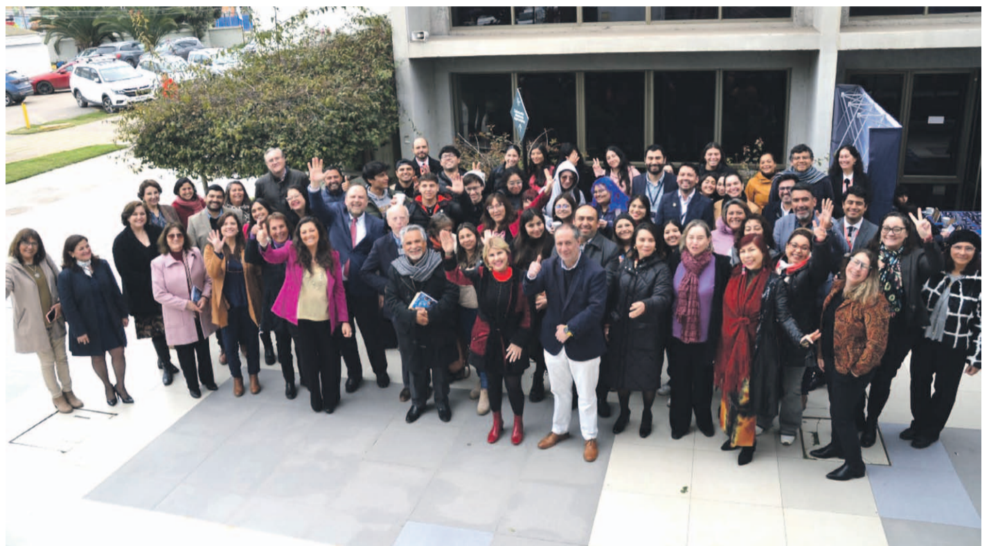
El encuentro de académicos compartieron sus conocimientos y experiencias sobre cómo la innovación tecnológica está redefiniendo el rol del profesor universitario y la experiencia de aprendizaje.