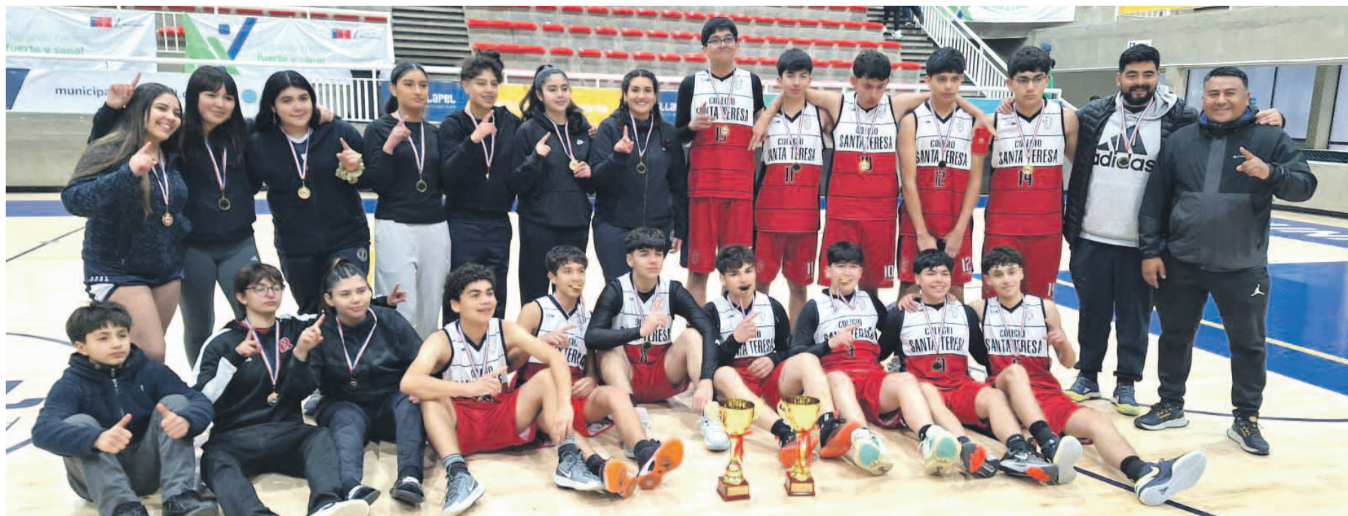
El representativo del Colegio Santa Teresa se quedó con el provincia en Choapa, tanto en damas como en varones.