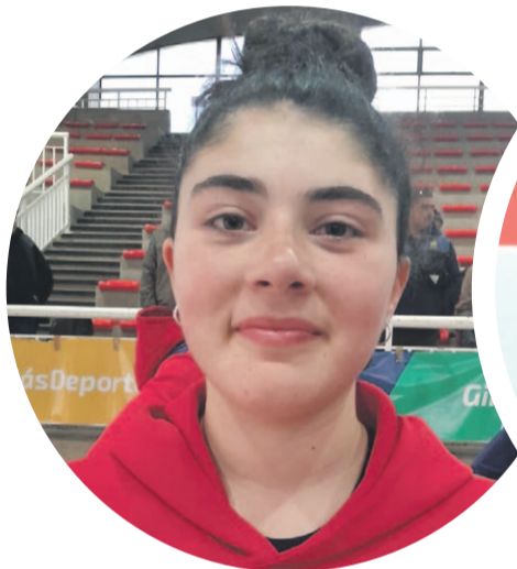
Trinidad asegura que la clave del título del Colegio Santa Teresa a nivel regional, es que la mayoría de las jugadoras juega habitualmente en clubes y conocen de memoria su juego.