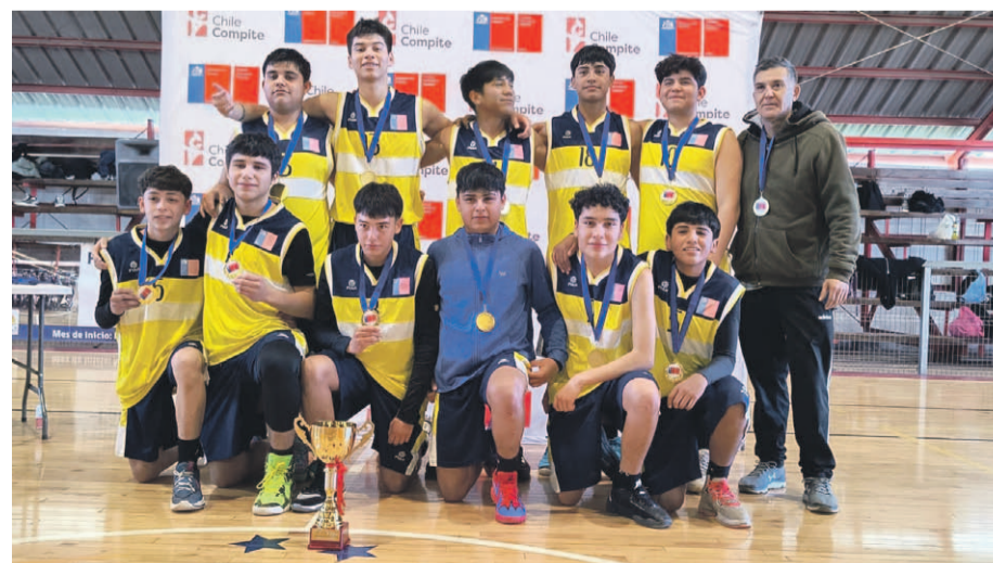
El Liceo Samuel Rojas debió mostrar su jerarquía para dejar en el camino a sus pares del Alberto Gallardo Lorca - como también al San Viator - con triunfo para el primero por 62-17.

mo partido doblegaron al liceo Federico Lohse de Los Vilos por un marcador de 60 a 39.