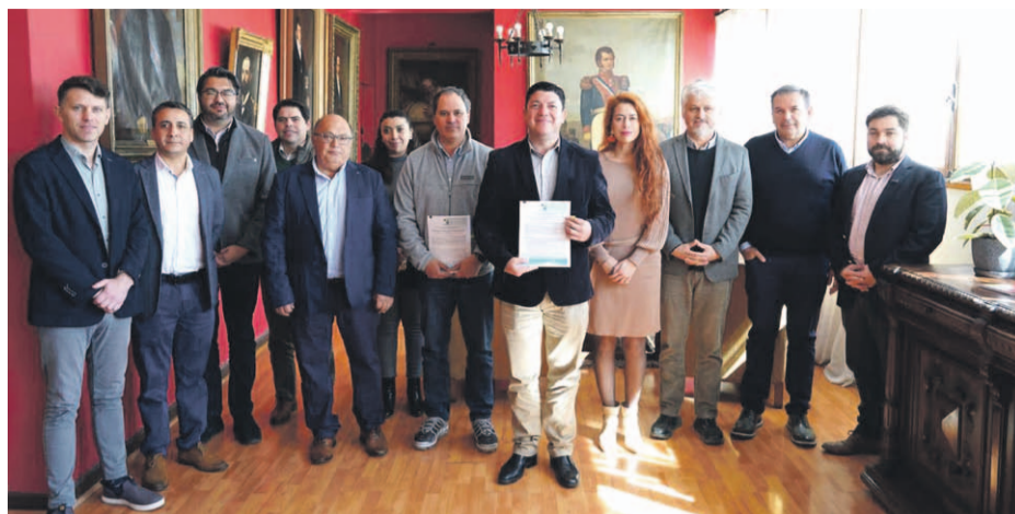
El monto traspasado a la corporación superó los 670 millones de pesos.

unas directrices para poder generar algunas reformas estatutarias y por supuesto también lo más importante, es la firma del convenio para darle continuidad a la Corporación Regional de Desarrollo Productivo, una entidad público-privada que nos ayuda muchísimo a apalancar recursos desde el sector privado para poder ir generando algunas iniciativas que estén ligadas a las distintas iniciativas productivas que se van dando, por supuesto, ligadas a la mirada