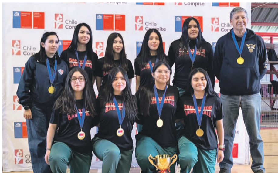
En damas, el Colegio San Viator accedió a la fase regional del básquetbol por la categoría Juvenil representando a Limarí.