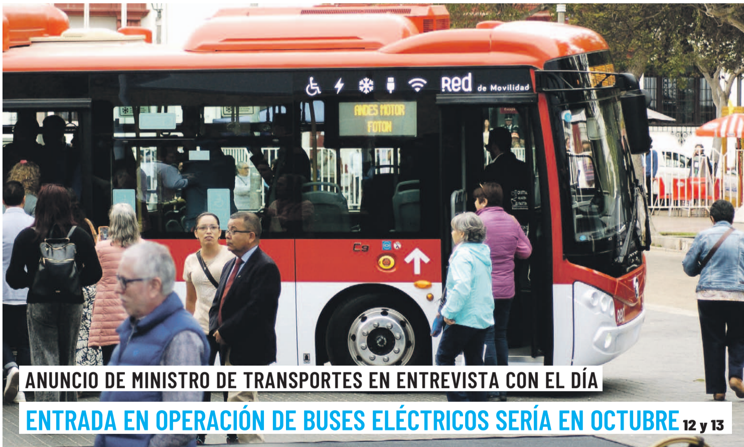
ANUNCIO DE MINISTRO DE TRANSPORTES EN ENTREVISTA CON EL DÍA