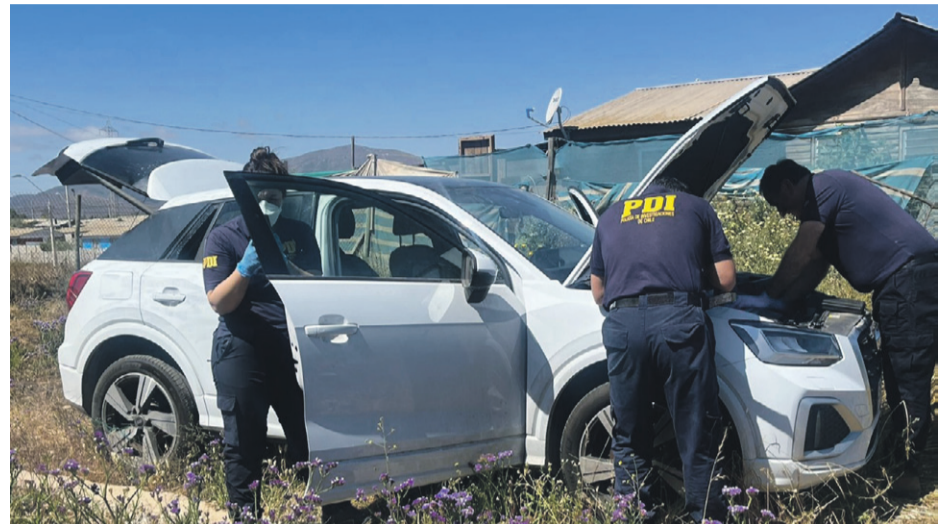
En 35 millones de pesos está evaluado el vehículo sustraído por delincuentes.

“Mediante la coordinación con el Ministerio Público, los detectives