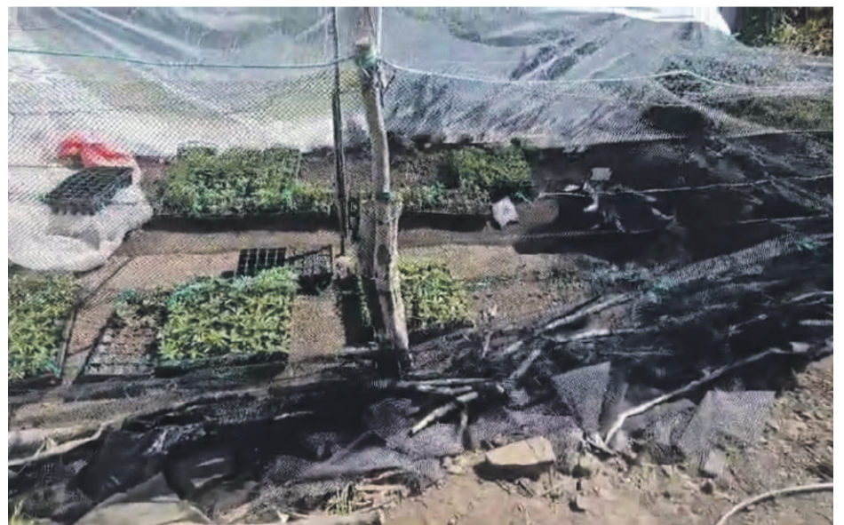
El “centro de cultivo” se emplazaba al borde una quebrada, en el sector de Tilama.

lucha por erradicar la droga y disminuir los narcocultivos en la región, como uno de los principales compromisos adoptados con la comunidad. Nosotros como carabineros estamos muy preocupados de poder atacar el delito de tráfico de drogas y entre ellos, están los planes de erradicación que realizamos todos los años. En ese contexto, logramos intervenir una plantación con más de 4.200 plantas del género cannabis sativa