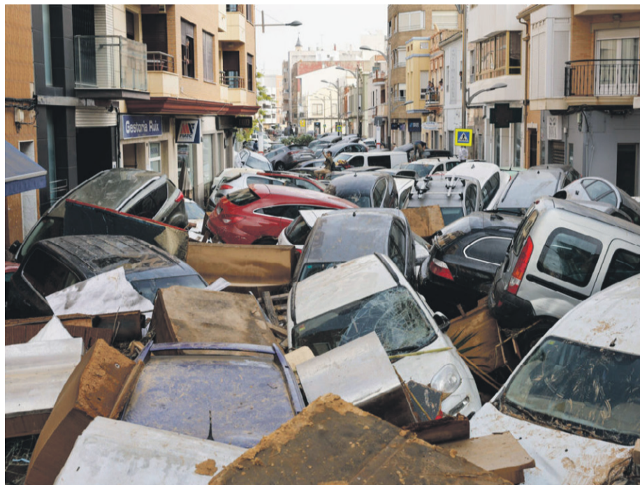
Imagen de autos arrastrados por las inundaciones en Picaña, España.

Las autoridades españolas trabajan en labores de rescate y en la identificación de los cuerpos, mientras luchan contra las noticias falsas que afectan la labor de los servicios de emergencia. A su vez, se suspendieron actividades parlamentarias en solidaridad con las víctimas y en apoyo a las zonas afectadas.