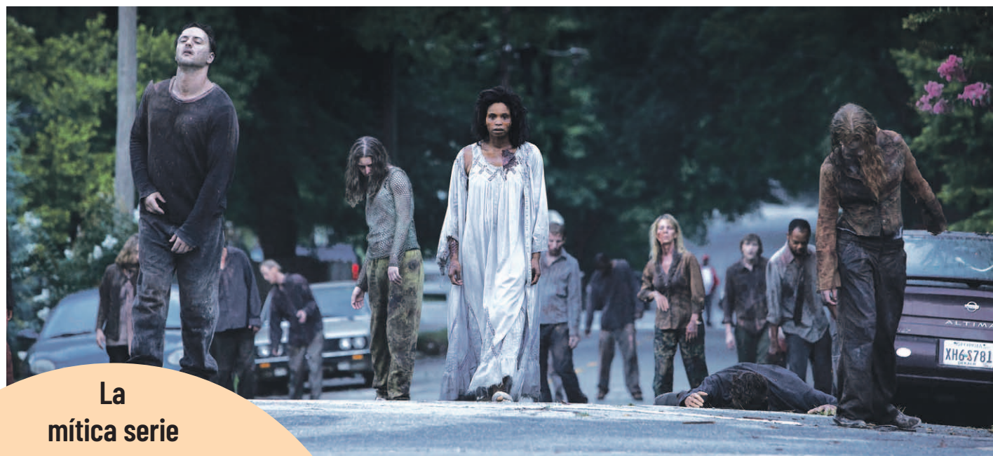
Escena de la temporada 11 de “The Walking Dead”.

El sheriff protagonista, que despierta de un coma en un mundo invadido por zombies, queda descrito como un hombre común que, ante una realidad de tal magnitud, reacciona con un profundo sentido del honor y la responsabilidad. El actor elegido para encarnar al personaje fue el británico Andrew Lincoln, conocido por su interpretación en “Love Actually” (Richard