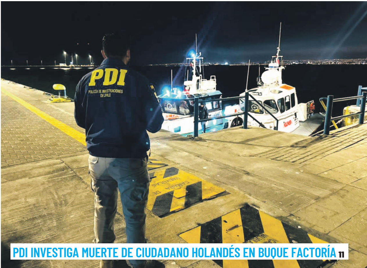
PDI INVESTIGA MUERTE DE CIUDADANO HOLANDÉS EN BUQUE FACTORÍA 11