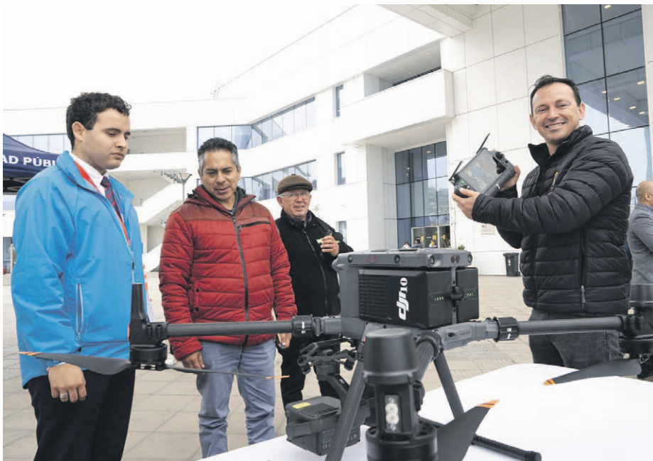
Los drones adquiridos son modelo Matrice 350 junto a sus respectivos accesorios.

junto a sus respectivos accesorios, cuya llegada a la comuna representó una inversión municipal superior a los $70 millones, y están destinados a reforzar las labores preventivas, de fiscalización y apoyo operativo en terreno, entregando una herramienta que amplía la cobertura y mejora la capacidad de respuesta ante situaciones de emergencia, eventos masivos o procedimientos de control, contribuyendo directa-