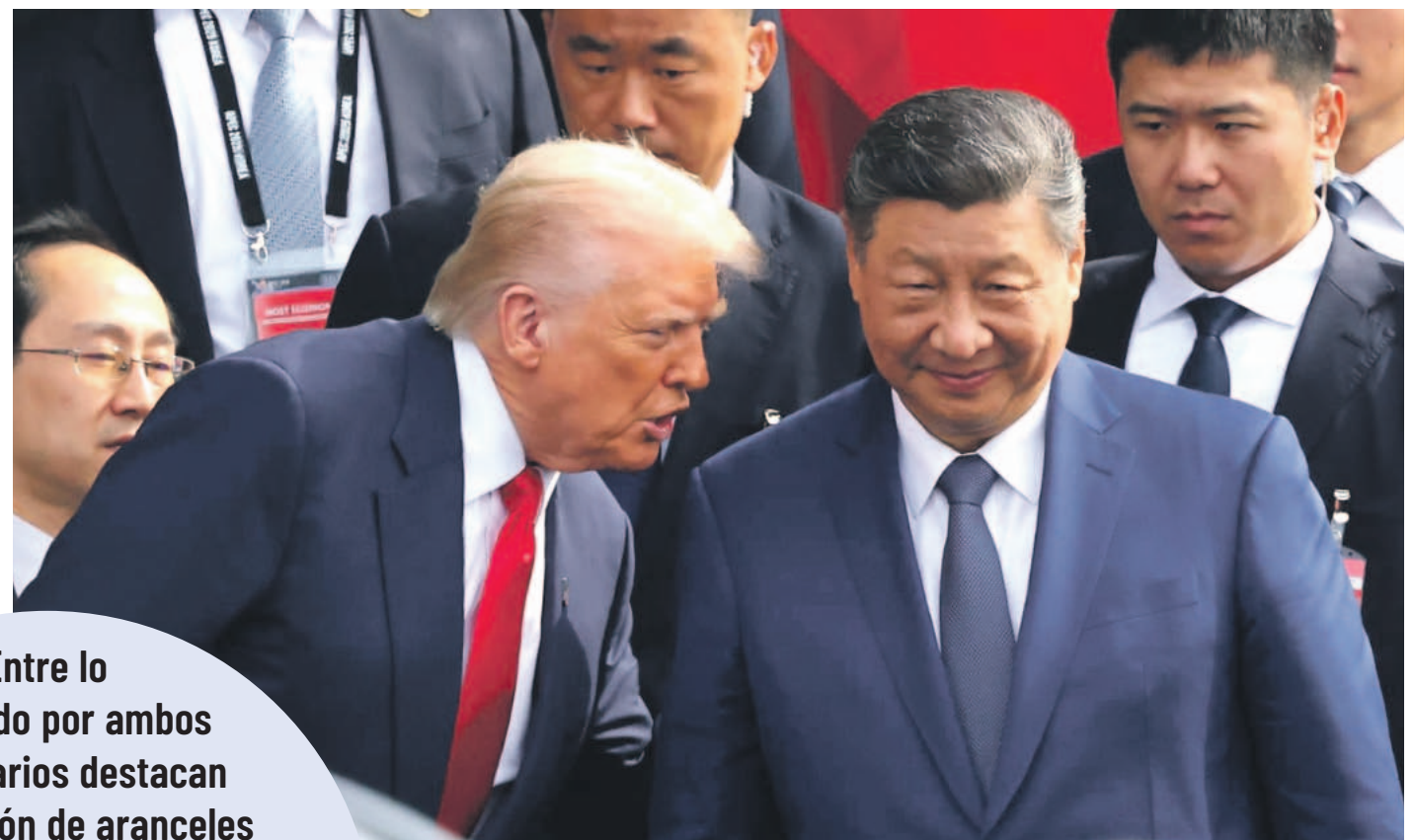
Donald Trump y Xi Jinping se reunieron en el marco de la realización de la cumbre del Foro de Cooperación Económica Asia-Pacífico (APEC) organizado en Corea del Sur.

Entre lo abordado por ambos mandatarios destacan la reducción de aranceles por fentanilo y la suspensión de restricciones a la exportación de tierras raras. También se pactó suspender tasas portuarias mutuas y China aumentaría la compra de soja estadounidense.