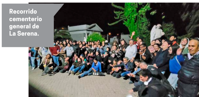
Recorrido cementerio general de La Serena.